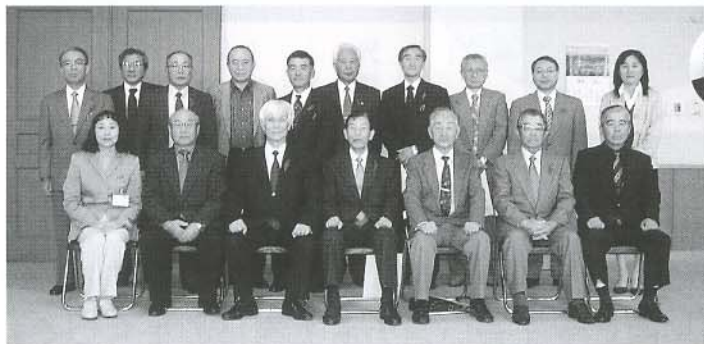
▲どうぞよろしく申し上げます