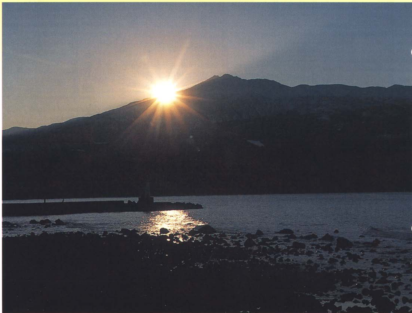
▲ 旭 光