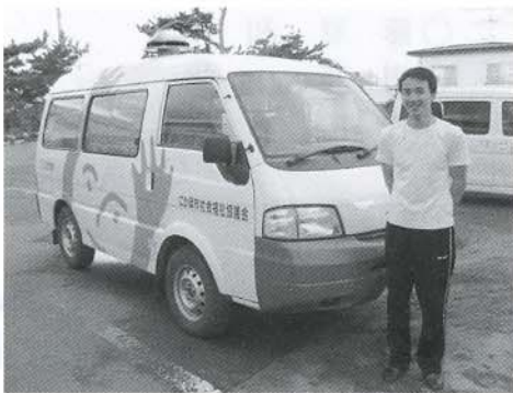
▲関さん これから訪問入浴車「ふろっこ2号」で利用者のお宅へ出発です