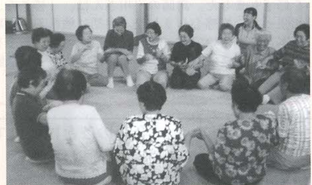
▲次から次へと回ってくるお花紙をテンボ良くバトンタッチ!! 「落とすなよ～」

金浦地域のアクティビティサービスでは、運動機能向上のために体操を実施しています。ダンベルやお花紙を使った体操で、普段の生活ではあまり使用しない筋肉を刺激することで、体力の向上とケガをしない体作りを目的としています。参加した皆さんは、ダンベルを力強く握りながら体を前後左右に動かしたり、お花紙を床に落とさないように必死になり、手渡しリレーに取り組んでいました。