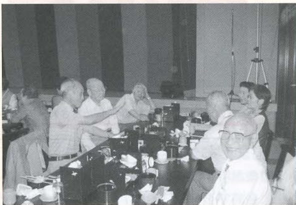
▲年に1度の交流会です。久しぶりの再会なので話題も豊富。友人との会話も弾みます。

9月14日(金)、仁賀保地域の一人暮らしや高齢者世帯の方々を対象に「ふれあい交流会」が開催されました。バス3台に分かれて、秋田市のこまち健康ランドへ出発。広い大浴場で日ごろの疲れをいやした後、大衆演劇を鑑賞しました。一日、のんびり、ゆったりとした時間を過ごし、参加した皆さんは、大満足の様子でした。