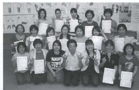
▲いただいた修了証を手に「ハイ、ポーズ!!」(象潟夜のコースに参加した皆さん)

5月から開催してきた「初級手話講座」は、9月21日をもちまして全15回の計画を全て終え57名の方が講座を修了しました。講師の平川さんは、「皆さん、一生懸命頑張っていて感心しました。手話に触れる人が増えてくれて本当に嬉しいです。これを機会にどんどん上を目指して頑張ってください。」と講座を修了した方々に激励の言葉を述べていました。