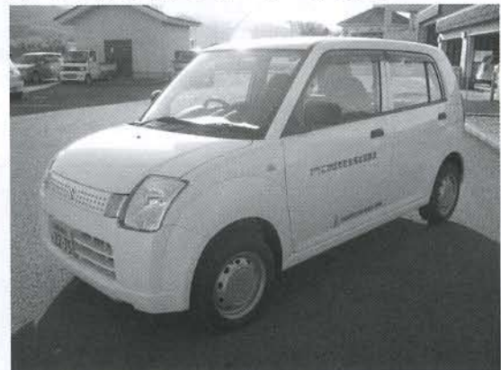
▲地域福祉のために活用しています

秋田県生命保険協会より「福祉巡回車」が寄贈されました。この車は、同協会に加盟する県内16社の社員の皆さんが集めた「ふれあい福祉募金」で購入されたものです。ありがたく使用させていただきます。どうもありがとうございました。