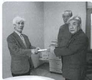
◀にかほ市老人クラブ連合会象潟町支部の皆様より1円ポスト募金で集まった募金をいただきました