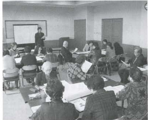
▲実際に地震が発生した直後の映像は、とても迫力がありました

ワークショップでは、4つのグループに分かれて討議を展開。活発な意見が飛び交い、とても勉強になった講座となりました。