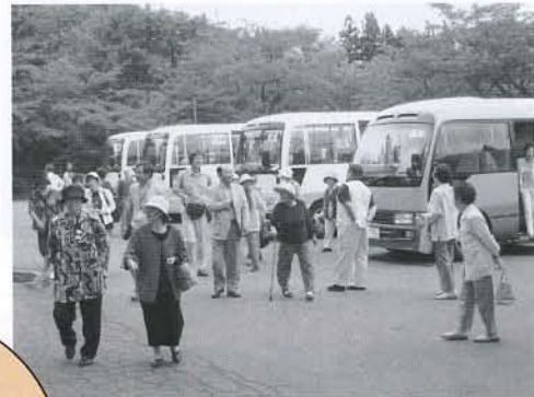
▲バス4台に分かれ大移動

7月11日(金)、象潟地域の一人暮らし高齢者を対象に「ふれあい交流会」が開催され、総勢97人が参加しました。あいにくの梅雨空でしたが、バスで十六羅漢岩(山形県遊佐町)や栗山池を巡り、懇親会のカラオケでは昭和の歌謡曲を合唱し、楽しいひと時を過ごしました。