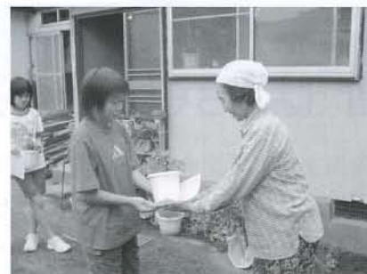
▲「いつまでもお元気で・・・」