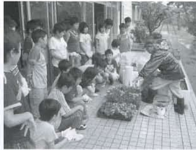
▲作業前、真剣に話を聞いています

七月七日(月)、五・六年生の皆さんが協力し合い、心をこめて約六十鉢の花の鉢植えを作りました。