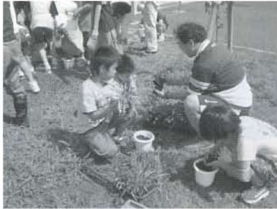
▲「なかなか、むずかしいなあ」