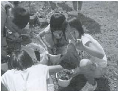
▲上手くできて、はいポーズ