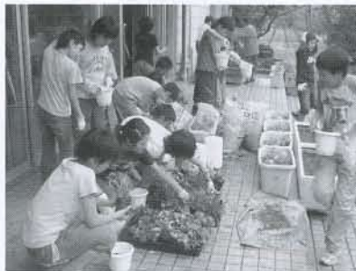
▲いよいよ、作業スタートです