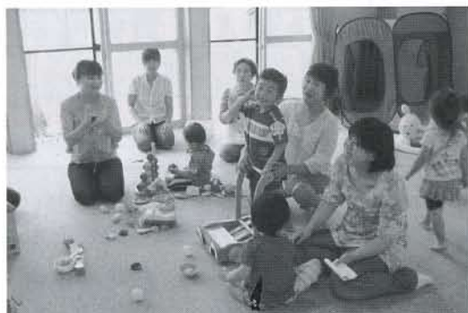
▲「これは何かな…？」エプロンシアター鑑賞中

6月20日(金)、「元気百歳館」において、「おもちゃライブラリー」を開催しました。金浦地域では、初めての開催ということで、少人数の参加となりましたが、たくさんのおもちゃや、ボランティア「メルヘン」のみなさんによる体操や手遊びで大いに楽しみました。