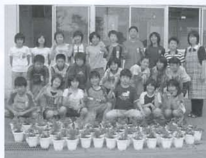
▲出来ばえに大満足です