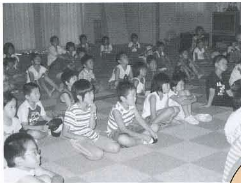
▲真剣なまなざしでスクリーンに釘付け

にかほ市社会福祉協議会では、7月31日(木)、金浦小学校の児童を対象に、「映画上映会」を開催しました。社協事業として、今回が初めての開催となりましたが、会場となった「元気百歳館」に約60人の児童や保護者が集まり、楽しい上映会となりました。