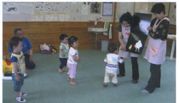
▲おもちゃボランティア「メルヘン」の皆さんが、大型絵本を披露してくれました

6月23日(月)、象潟支所にて記念すべき第1回目となる「おもちゃライブラリー」が開催されました。子どもたちは、自分の家にはない大きなおもちゃに少々興奮した様子で、はしゃぎながら遊んでいました。