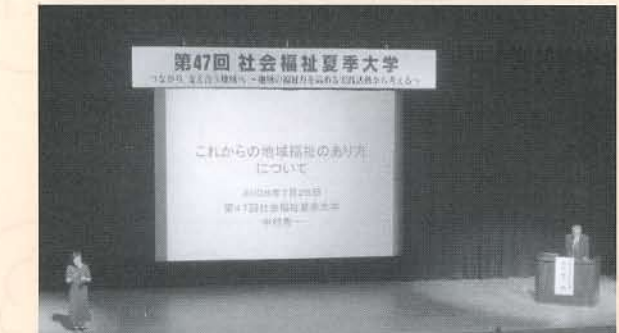
▲全国から約600人の地域福祉に感心のある方々が集まりました

実践発表された優秀な団体に共通しているものは、どの団体も職員の努力に支えられている面が大きいという事です。このことは、発表されなかった県や