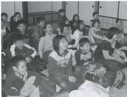
▲24名の子どもたちが参加し、映画鑑賞を楽しみました

1月8日(木)、冬休み中の小出小学校の児童を対象に、小出老人憩の家「けやき」にて「映画上映会」を開催しました。参加した子どもたちの視線は、迫力ある映像が繰り出される大スクリーン一点に集中。笑い感動を共有していました。また冬休み中なので、久しぶりに会った友達との会話もはずみ、有意義な時間となりました。