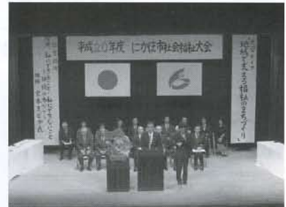
▲にかほ市長様より、ご祝辞をいただきました