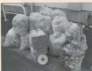
◀仁賀保地域で集まったゴミ可燃ゴミは、86.5kg！！

全体の合計 可燃ゴミ 206.5kg (43袋) 不燃ゴミ 42.7kg (9袋)