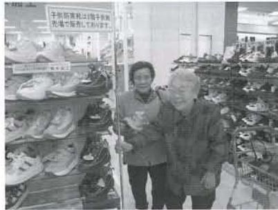
▲品数の多さに目移りしていました

十二月十九日(金)、「高齢者生活支援買い物ツアー」が行われ、イオン三川店と庄内観光物産館に出かけました。お天気にも恵まれ師走という事もあり、店内は大変混雑していましたが、参加した皆さんは、あまり行く機会が少ない大型店の雰囲気を楽しみ、楽しいひとときを過ごしました。