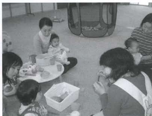
▲たくさんのおもちゃを前に、子どもたちは、興味津々な様子でした

にかほ市のボランティアグループ「おもちゃライブラリーきしゃぼっぼメルヘン」のご協力を得て、フェライト子ども科学館で月に3回開催されている、おもちゃライブラリー事業を、今年度から金浦地域でも行っています。今年度2回目となるライブラリーを11月7日（金）に開催しました。子供同士の交流だけでなく、親同士の交流や子育ての悩み相談など、幅広い部分で子育ての総合的な支援に繋がっていくことを期待しています。