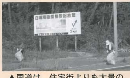
▲国道は、住宅街よりも大量のゴミがあり、空き缶などの不燃ゴミも目立ちました