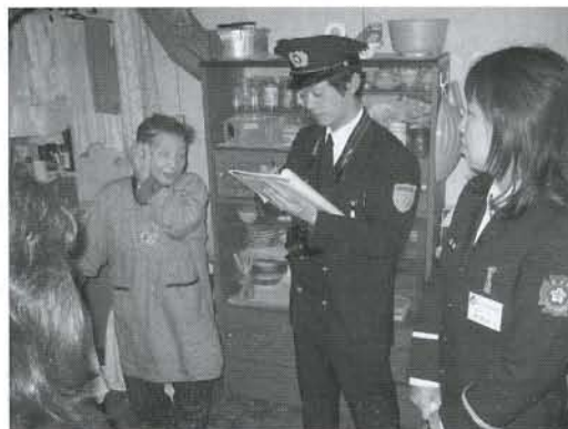
▲火気の取り扱いについて、注意事項をご指導していただきました

11月10日（月）、一人暮らし高齢者宅の防火査察が行われました。当日は、にかほ市消防署の署員並びに女性消防団の方から象潟地域の一人暮らし高齢者宅4世帯を巡回訪問して頂き、暖房器具や台所用コンロなどの火の元を点検、指導して頂きました。訪問を受けた皆さんは、火の元の管理や防火意識に関心を高められました。