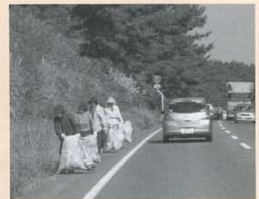
▲持ち歩くには、重いほどのゴミが集まりました