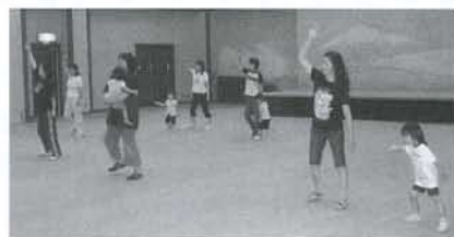
▲親子リフレッシュ教室