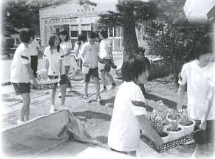
鉢の作り方を聞きながら、作業スタート！ きれいに植え替え終了しました。(上郷小学校)