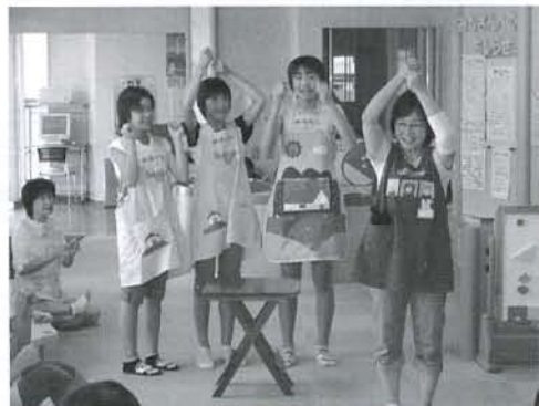
▲フェライト子ども科学館で開催しているおもちゃライブラリーで、子どもたちにエプロンシアターを披露しました

仁賀保地域で、小中学校の夏休みに合わせて行っている「サマーボランティアスクール」を各種団体や関係機関の協力を得て今年も開催し、10種類の教室に延べ273人が参加しました。中でも人気なのが、園児とふれあえる“保育園”や未就学児とふれあえる“おもちゃライブラリー”で、参加した児童や生徒たちは、始めは緊張していましたが、終わるころには交流が深まり、笑顔が見られ、「また来年も是非参加したい。」という意見が多く聞かれました。