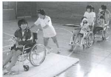
▲象潟小学校福祉体験