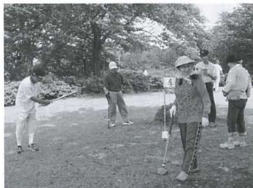
▲優勝目指して、実力発揮!!

7月26日(日)、南極広場において、にかほ市金浦地域市民グラウンド・ゴルフ大会が66名の参加を得て開催されました。社協では、この大会にシルバー健康推進事業の一環として協力しています。前日まで天候が不順で開催が心配されましたが、当日は日差しも強く、参加された皆さんは汗をかきながら、1コース8ホールを3コース、合計24ホールを回り、日頃の練習の成果を競い合いました。