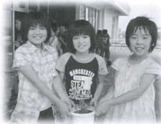
3人1組で、鉢を作りました。(金浦小学校)