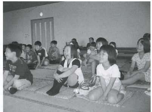
▲友達と一緒に見て、楽しさ倍増！！

夏休み中の7月30日(木)、象潟都市農村交流センターにおいて、上浜小学校の児童と保護者を対象に「映画上映会」を開催しました。18名の皆さんが集まり、ビデオ「水の事故と安全」で水遊びでの注意点を学んだ後、ドラえもんの映画を楽しみました。スクリーンを見つめるまなごしは、真剣そのもの。「来年も、また開催して欲しい。」との声が聞かれ、好評でした。