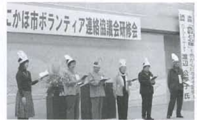
▲ボランティア連絡協議会研修会