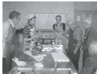
▲シルバー料理教室