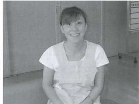
▲1日に、3～4軒の利用者のお宅を訪問し、調理や清掃に励んでいます。