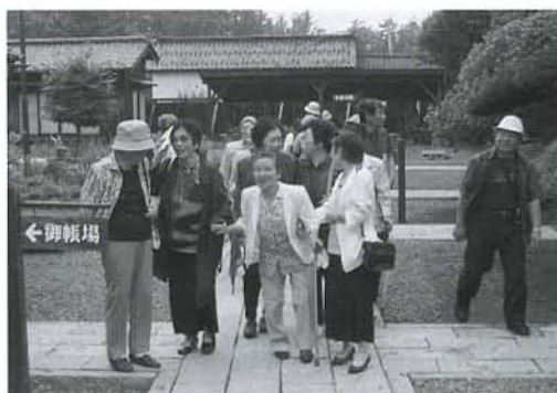
▲旧青山本邸内を見学、散策しました

7月10日(金)、象潟地域の一人暮らし高齢者の方々を対象とした「ふれあい交流会」を開催し、総勢97名が参加しました。交流会では山形県遊佐町の「旧青山本邸」を見学し、「象潟シーサイドホテル」に会場を移して、昼食を兼ねて懇親会が開催されました。参加された皆さんは、お互いの健康を確かめ合い、来年度の再会を約束し、有意義で楽しいひとときを過ごされました。