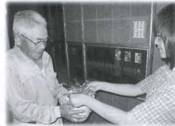
植え替えした花と絵手紙を、おじいさん、おばあさんへ届けました。(釜ヶ台小学校)