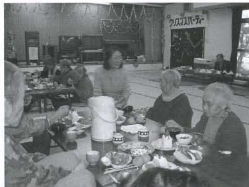
▲おいしい料理とクリスマスケーキを食べて、大満足の日でした

12月22日(火)、象潟地域のふれあいデイサービスでクリスマス・パーティーを開催しました。参加した皆さんは、ボランティアの友愛ヘルパー協議会の皆さんからクリスマス料理の手ほどきを受け、出来上がったご馳走に舌つづみを打ちながら、仲間同士の談笑や余興などで大いに盛り上がりました。1年間、皆さんと健康に過ごしたことを喜び合うとともに、来年もお互い元気で再会することを約束しながら、楽しいひと時を過ごしました。