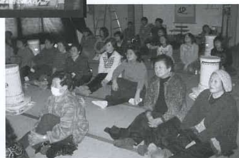
▲障害を持つ親子の実話をアニメ化した「どんぐりの家」を鑑賞しました