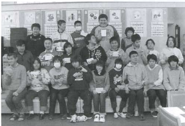
▲最高のクリスマスプレゼントになったようです

十二月二十二日(火)、「クリスマス忘年会開催中のさん・とらっぷ」を訪問しました。