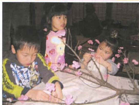
▲ うめ の枝に、もちの花を咲かせました

さて、1月9日（土）、旧佐々木家住宅「まがりや」にて、毎年恒例になりました「新春もちつき大会」を開催しました。当日は、18組の親子連れ（大人21人、子ども30人）が参加し、もちつきや昔の遊びを体験。つきたての美味しいもちを食べて、お正月行事を満喫しました。