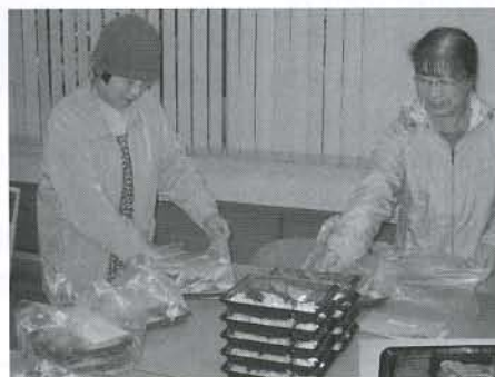
▲仁賀保地域には、43名の福祉員があり、その内の23名(弁当利用者がある集落の福祉員)がお弁当の配達に協力しています

毎月、第2・4水曜日は、福祉員の皆さんがお届けする「ふれあい弁当」の日です。皆さんは、午後3時以降に、スマイルでお弁当を受け取り、自分の集落でふれあい弁当を利用されている方々の家を訪ねます。そして、実際にお会いして声をかけ、安否確認も兼ねながら、お弁当を配達しています。利用者にとって身近な存在である福祉員の皆さんは、社協と利用者との掛け橋となっており、社協にとって一番の要として活躍していただいております。