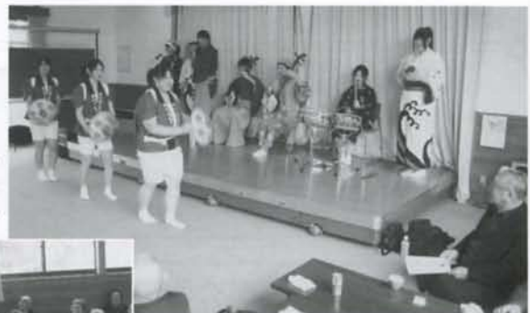
▲「こんなに間近で楽しめて、感激です。」