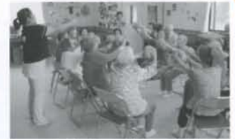
▲アクティビティ事業