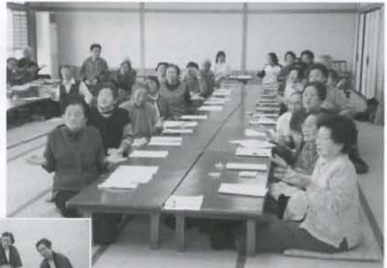
▲「体操して、踊りも見て、懐かしい顔に出会えて、楽しかったなあ」