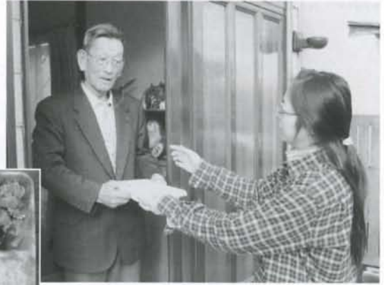
▲「いつも配達ありがとう」