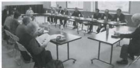
▲町内会長、民生児童委員、福祉員会議