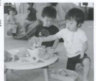
▲おもちゃライブラリー事業