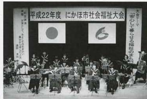
▲ソロパートでの演奏はより観客の目を引きました

式典終了後は、大会アトラクションが行われ、にかほ市立仁賀保中学校吹奏楽部の皆さんによる演奏が披露されました。「学園天国」や芝居を交えた「赤いスイートピー」など全4曲、心のこもった演奏がプレゼントされました。