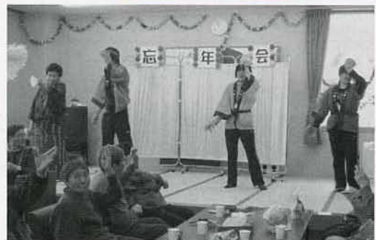
▲みんなの心が一つになった職員の演芸