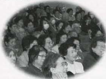
▲空席がないほど多く集まりました