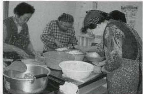
▲調理に奮闘する参加者の皆さん