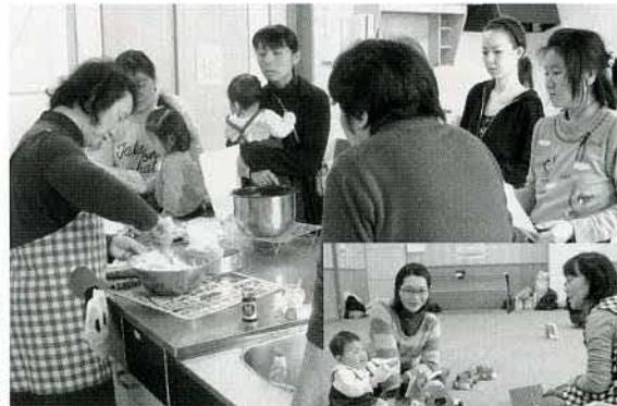
▲初の試み、大成功! 炊飯器で作ったケーキおいしくできました

3月21日(水)、金浦保健センターにて、今年度最後のおもちゃライブラリーを開催しました。肌寒い天候でしたが、7組15名の親子が集まり、広い部屋で、たくさんのおもちゃで思い思いに遊び楽しみました。今回は、いつもボランティアに来て頂いている方をお願いして、簡単なケーキ作りの実演を行いました。少しの間、お母さんは子どもさんと離れて実演を見たり、出来上がったケーキを試食したりと、いつもと違うリフレッシュ感を味わったようです。