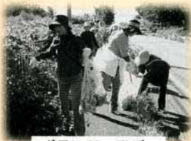
ボランティアデー