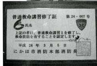
▲真剣に取り組み、立派な修了証をいただきました