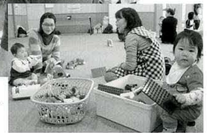
▲いつものおもちゃ遊びも好評でした