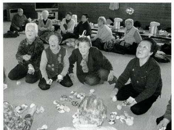
▲昔の特技「お手玉」は、今でも健在

にかほ市社会福祉協議会では、各地域で「ふれあいディサービス」を毎月1回開催しています。仁賀保地域では、午ノ浜温泉を会場に血圧測定、入浴、ゲームや創作活動等を行っております。外出や体を動かす機会が少なくなる冬期間は、昔ながらの遊びを通じて体力の維持や参加者同志の交流を深めています。興味のある方は、各支所までご連絡下さい。