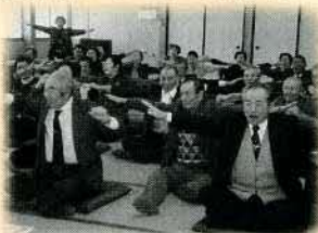
雪国高齢者の健康づくり事業