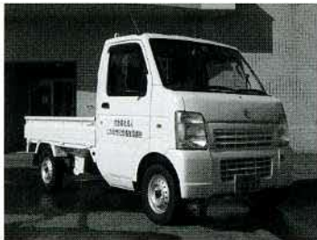
▲昨年度、地域支え合い事業補助金を利用して購入した軽トラック

にかほ市社協では、今年度より新規事業として、住民が主体的に高齢者等への支援を行う活動のために、自治会（町内会）や民生児童委員、福祉員、地域住民等に対して軽トラックを貸し出します。貸出料は無料ですが、保険料として1日につき200円の支払いをお願いしています。詳しい内容を知りたい方は、各支所までお問い合わせ下さい。