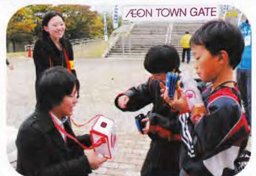
▲ 観戦に来た小学生も喜んで募金してくれました。どうもありがとう。