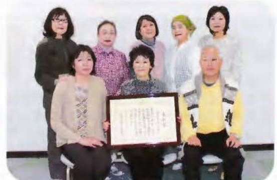
▲受賞された読み聞かせの会「いぶき」の皆さん

こびあでの絵本の読み聞かせや小学校での朝読みなど長年の功績が認められての受賞となりました。おめでとうございます。