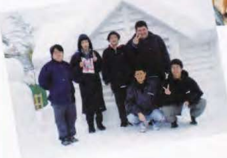
▲第11回本人活動では、湯沢市の犬っこまつりに行き、湯沢市の育成会及びNPO法人ビーイングの方々とお交流しました (H25.2.9開催の様子)