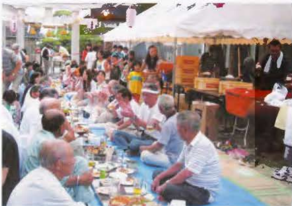
▲夏祭りには約150人が参加し、ラムネ早飲み競争やピンゴゲームなどで盛り上がりました

8月10日(土)に開催。 = 中橋町内会 = 夏祭りとグラウンド・ゴルフ大会を通じて、町内住民の融和と絆を深めるとともに健康増進を図ることができました。