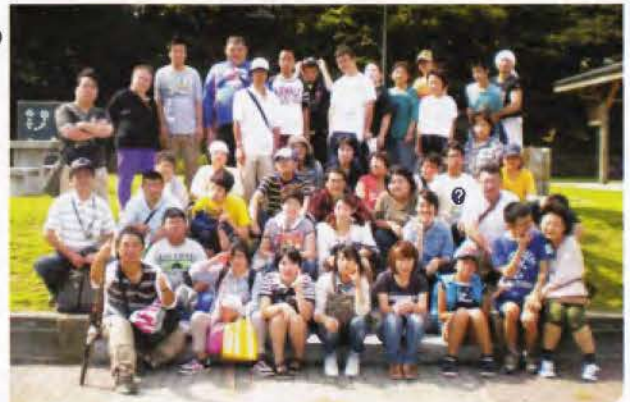
▲第13回本人活動では、念願の飛島へ行きました。船酔いに悩まされ、本人たちの想像とはちょっと違う結末!? 記念の一枚「はい、チーズ!」 (H25.9.21開催の様子)