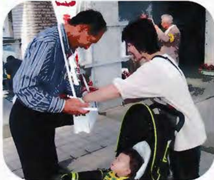
▲老人クラブ連合会の方々が庁舎を訪れた皆様へ呼びかけました。 （にかほ市役所象潟庁舎前）