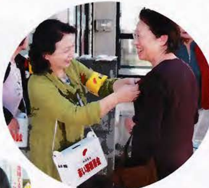
▲通行中の市民の皆様へ社協役員が呼びかけました。 （山海堂前）