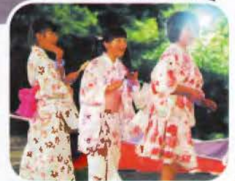
▶夏祭りはやっぱり浴衣ですね