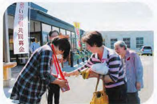
▶ 陣屋の職員の方と観光中と思われるお客さん方が多数募金してくれました。手話サークル「しおさい」の方々が呼びかけました。 （にかほ陣屋前）