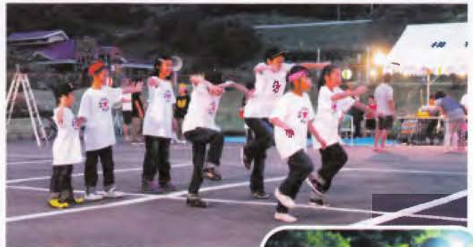
▲スタジオドリームスの皆さんによるステージの様子

8月24日(土)に開催。 = 横根自治会 = 160人が参加し、ダンスと民謡の鑑賞や屋台での飲食物の販売を通して地域の活性化と親睦を図りました。