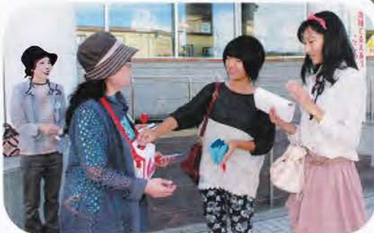
▲電車時間間近に活動。おもちゃボランティア「メルヘン」の方々が呼びかけました。 （仁賀保駅前）