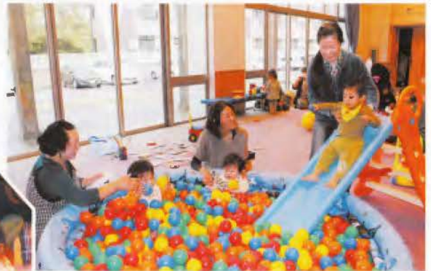
▲滑り台の先にはボールプール。この遊び方を発明してくれたのは、前回サマーボランティアスクールと一緒に遊んでくれたお兄さんたち。今回も大人気でした。