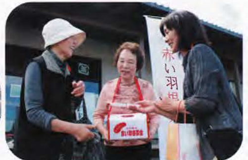
▲買い物に来たお客さんへ、かいごサークル「麻の会」の方々が呼びかけました。 （物産所百彩館前）