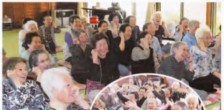
▲皆さんの笑顔、輝いています。

ミニデイサービス(生きがいと健康づくり推進事業)は、市から委託を受け行っております。