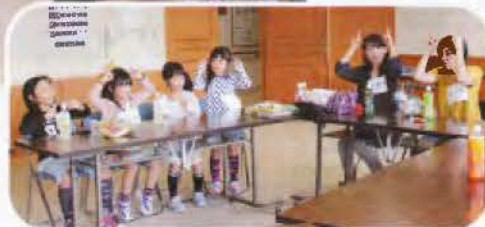
▲子どもたちが好きな動物の手話を覚えました