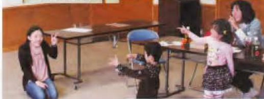
▲めくったカードに描かれた絵を手話で表すゲームをしました