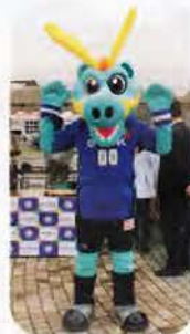
◀ ブラウゴンも胸に赤い羽根を付けて運動をPR。