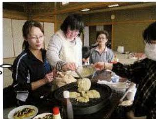
▲障害者(児)日中一時支援事業