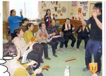
▲生きがいと健康づくり推進事業（ミニデイサービス）