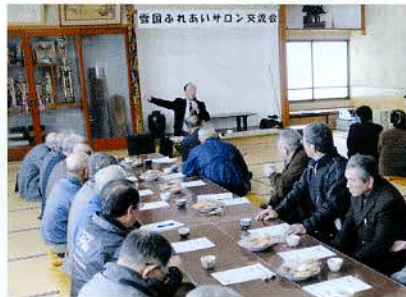
▲体操のはずが…、笑わずにはられません