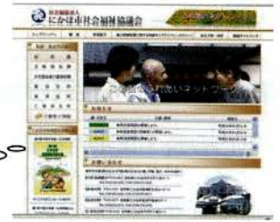
▲ホームページの公開

※ ● ⇒ 赤い羽根共同募金配分金を活用して実施している事業です。（一部活用含む） ◆ ⇒ にかほ市からの受託事業及び補助事業です。