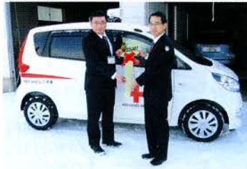
▲にかほ市地区への寄贈は2台目です

2月7日(木)日赤秋田県支部より災害救援車1台を寄贈いただきました。地域における赤十字活動や地域福祉活動の推進のための活用を目的としており、平成25年度はにかほ市を含む7市町村へ寄贈されました。