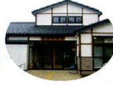
金浦支所 (元気百歳館)