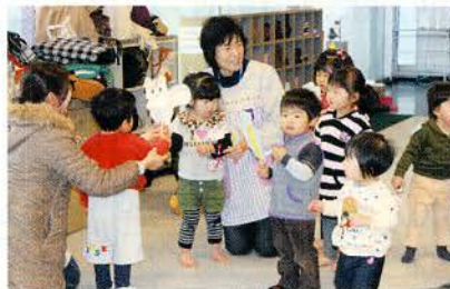
▲音楽に合わせみんなで体操!