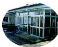
象潟支所 (老人福祉センター)

にかほ市社協では、4月より土・日曜日・祝日も支所・事業所における電話や来所での生活相談・介護相談などの受付を始めました。