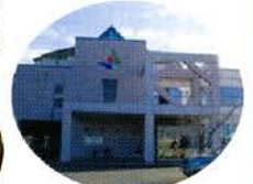
仁賀保支所 (スマイル)