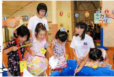
▲サマーボランティアスクール事業