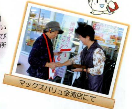
マックスバリュ金浦店にて