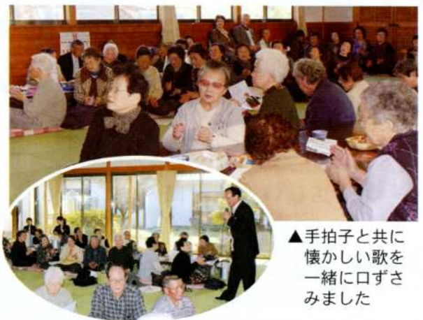
▲手拍子と共に懐かしい歌と一緒に口ずさみました

懐かしい演歌や民謡の他、蔵元さん自身、歌う度に故郷の情景が思い出され故郷が恋しくなり、実家に帰りたいくなるというデビュー曲「望郷ひとり酒」を歌って頂きました。参加された皆さんは、いぶし銀の哀愁たっぷりの歌声に酔いしれ、楽しい時間を過ごされました。