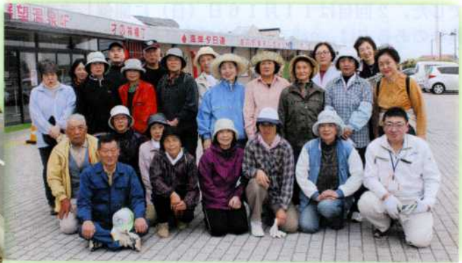
▲障がい福祉サービス事業所「さん・とらっぷ」からも4名が参加してくれました