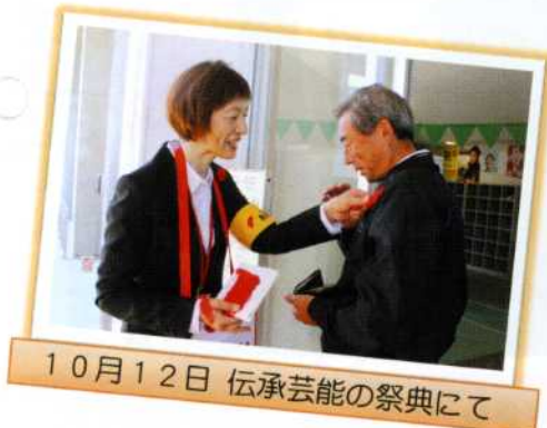
10月12日 伝承芸能の祭典にて