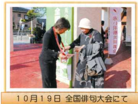
10月19日 全国俳句大会にて

国文祭イベントともあり、県外からいらしたお客さんも多数ご協力してくれました。(3日間合計・概算300名以上) 募金してくれた皆さん、どうもありがとうございました。