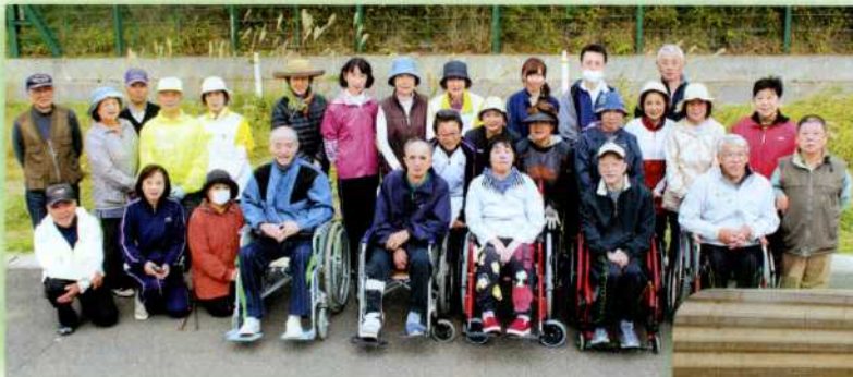
▲初参加となった障害者支援施設「金浦療護園」から入居者及び職員の方々9名が協力してくれました

金浦地域は、 岡の谷地グラウンドをスタートし、2方向に分かれ海岸通りのごみ拾いを実施しました。