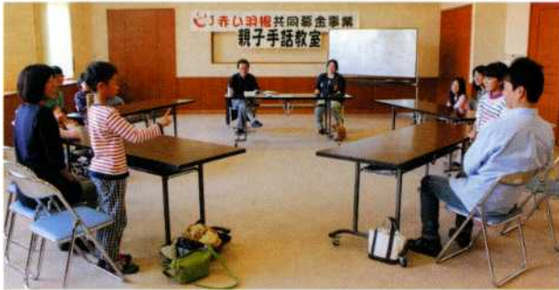
▲挨拶を交わし、手話で自己紹介をしています

10月26日(日)スマイルにて、親子で手話を体験してもらおうと「親子手話教室」を開催しました。自分の名前や好きな食べ物、チーム戦によるジェスチャーゲームを行い、会場には笑い声だけが響き渡りました。この日、初めて手話に触れた親子からは「楽しかったです。次も参加します。」との声をいただき好評でした。2回目は11月16日(日)に開催します。興味のある方は、金浦支所までご連絡を…(☎38-2375)