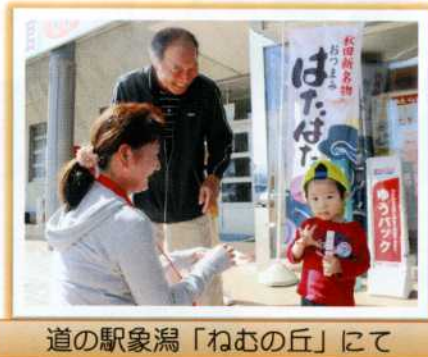
道の駅象潟「ねむの丘」にて

ボランティア団体及び福祉団体のご協力の成果もあり、昨年の実績を上回ることができました。 募金してくれた皆さん、どうもありがとうございました。