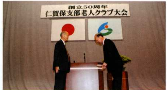
▲支部老ク連会長より板垣社協会長へ手渡されました

その席上で、にかほ市社会福祉協議会へ1円ポスト募金の一部10万円が寄付されました。地域福祉活動の推進のため、大切に活用させていただきます。どうもありがとうございました。