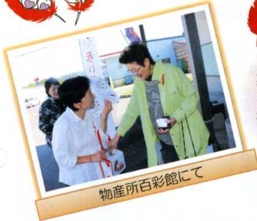
物産所百彩館にて