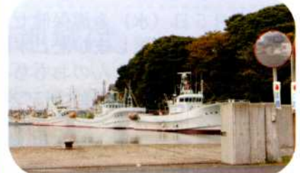
▲3町内から見た金浦漁港 このおだやかな海が…

日本海までは目と鼻の先に位置し、標高1.6m、10m以上の津波が発生した場合7.0m浸水する恐れがあるところです。