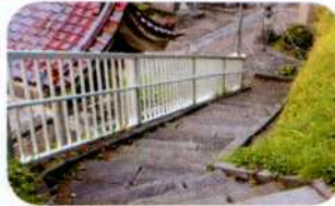
▲避難経路の階段 数えると何と70段!!

段を上り避難するのが大変。「自分の命を大切に…。自分の命は自分で守って。生きて下さい。」私はいつもそう言って励ましているのですが、もう少し避難しやすい道だったら…と思わずにはられません。