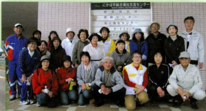
▲8つのボランティア団体より、参加・協力してくれました