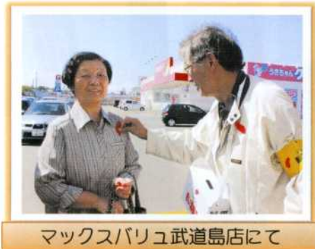
マックスバリュ武道島店にて