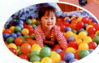
◀カラフルなボールに興味津々！

「おもちゃライブラリー」は、赤い羽根共同募金配分金の一部を活用して実施しております。