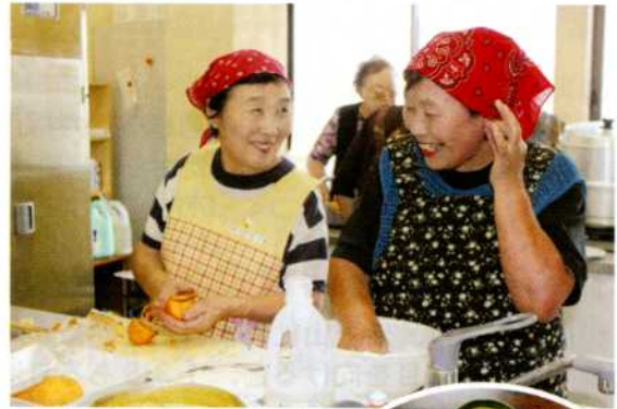
▲「耳たぶの固さってどのくらい？」 実際に触って比較中！

参加された皆さんは和気あいあいと手際よく調理に取り組み、調理室は熱気と歓声に包まれました。調理後は全員で会食。料理の出来ばえに舌つづみを打ちながら調理方法を振り返り、有意義で楽しいひと時を過ごされました。