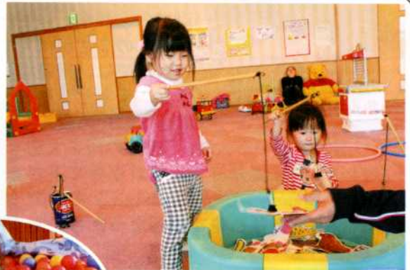
▲魚釣りに挑戦中！ 「どんな魚が釣れたかな？」