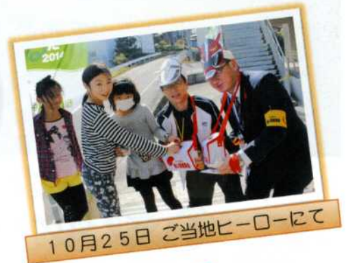
10月25日 ご当地ヒーローにて