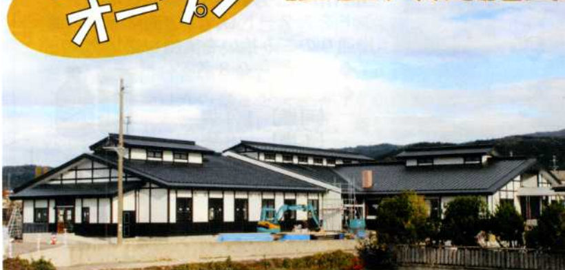
▲建設中の外観写真(11月6日現在)

にかほ市社会福祉協議会では、この度「秋田県木造公共施設等整備事業(※)」補助金を活用して、念願でありました福祉交流施設を建設中です。只今、建設のラストスパートに入っており完成予定は11月末となっております。