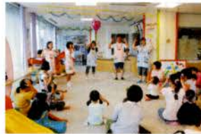
▲サマーボランティアスクール