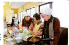
▲シルバー料理教室