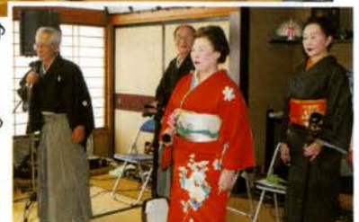
▶渚会の皆さんによる最高のステージ!!

🍒「雪国高齢者の健康づくり事業(雪国サロン交流会)」は、赤い羽根共同募金の一部を活用して実施しています。