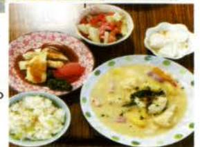
▶春のように色鮮やかに完成!!