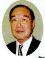
新年度にあたって