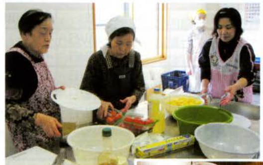
▲旬の野菜を仕込み中!

3月10日(火)元気百歳館にて「シルバー料理教室」を開催しました。メニューは「たらとジャガイモのシチュー」、「フキご飯」、「タケノコの天ぷら甘酢あんかけ」、「大根とサーモンのサラダ」、「メープルシロップのブラマンジェ」の全5品。栄養士の資格を持つ社協職員の指導の下、約2時間で手際よく作り上げ、ふれあいデイサービスの参加者と一緒に会食しました。これから旬を迎える山菜や、野菜、魚を使った栄養満点の料理に笑顔満開となり、デザートของブラマンジェは初めて口にした方も多く、とろけるような舌触りがとても好評でした。