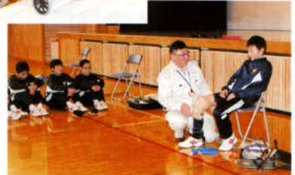
▲膝が思うように動かない…戸惑ってしまいました