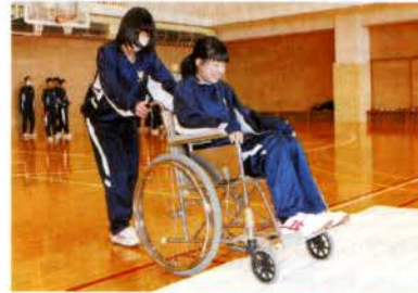
◀友達を信じて…車イス体験中

3月12日(木)社協職員が講師となり、象潟中学校1年生を対象に「福祉体験学習」を行いました。参加された87名の生徒は、「車イス介助体験」、特殊な装具を使った「高齢者疑似体験」、アイマスクを着用した「ブラインド・ウォーク」の3つのコースに分かれ体験。高齢者疑似体験やブラインド・ウォークでは、動きにくく見えづらいこと、車イス体験では段差や乗った時の不安定さを介助される側、する側になり体感しました。体験後に生徒から「高齢者の方や障害のある方に会った時は優しく接したいと思いました。」との感想が聞かれ、今回の学習を通して思いやりの大切さを学ぶ有意義な時間となりました。