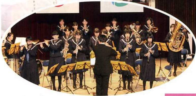
▲大会アトラクションにて にかほ市立象潟中学校吹奏楽部による 迫力ある演奏を披露していただきました