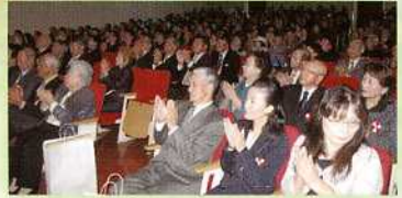
▲満席状態の会場の様子