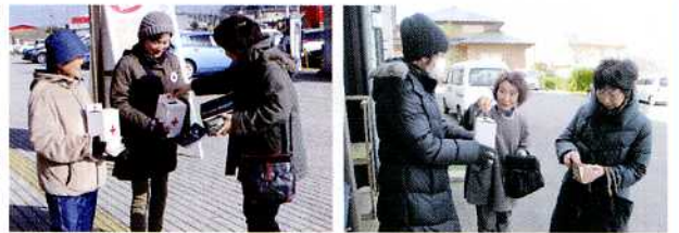
▲道の駅象潟「ねむの丘」にて

12月5日(土)全県一斉に行われた「NHK海外たすけあい」街頭募金活動において、にかほ市でも象潟地域及び仁賀保地域の赤十字奉仕団員14名が募金を呼びかけました。風が強くととても寒い日でしたが、多くの人に足を止めて頂き、集まった募金額は24,218円。これは日本赤十字社に集められ、世界各地の紛争、災害、飢餓などに苦しむ多くの人々を支援するために使われます。ご協力くださった皆様、本当にありがとうございました。