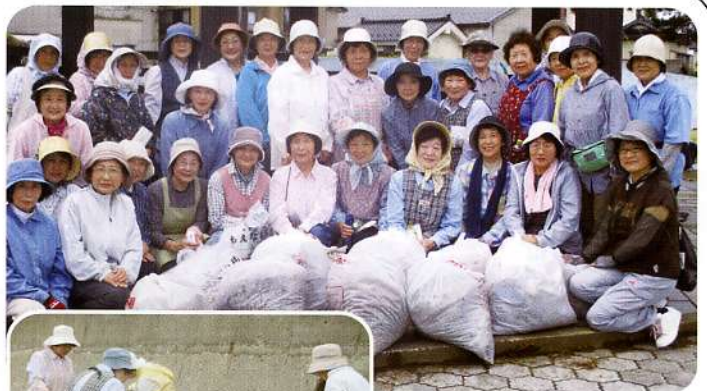
▲参加された団員の皆さん