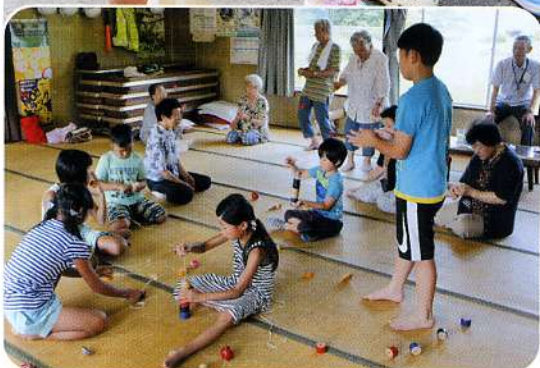
▲みんなで「昔の遊び」も体験しました