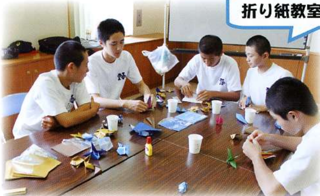
▲高齢者福祉施設に飾っていただくため、折り紙で作品を作成しました。