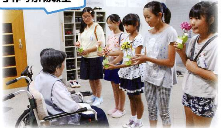
▲手作りのお花の置物を高齢者福祉施設にプレゼントしました。