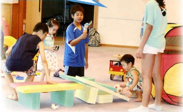
▲おもちゃ遊びを通じて子どもたちとふれあいました。