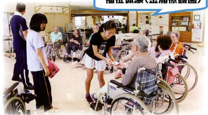
▲施設を利用されている方々のレクリエーションのお手伝いをしました。

◇ボランティアをお引き受けいただいた社会福祉施設や団体・個人の皆様に、心よりお礼申し上げます◇