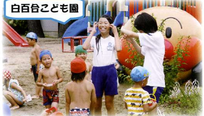
▲子どもたちに囲まれて、保育のお仕事を体験しました。