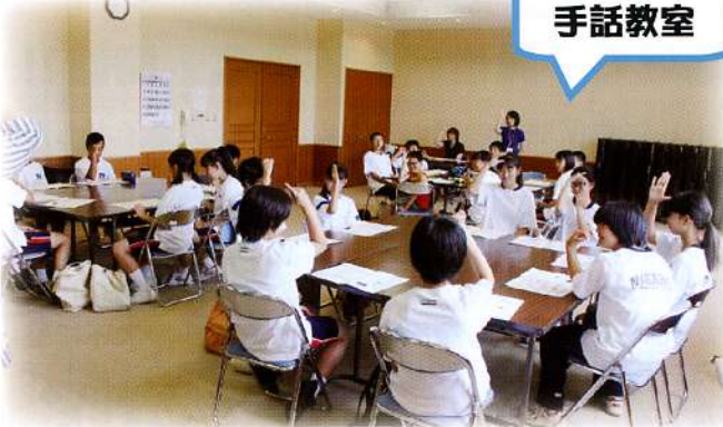
▲干支や名字などを使って楽しく手話を学習しました。