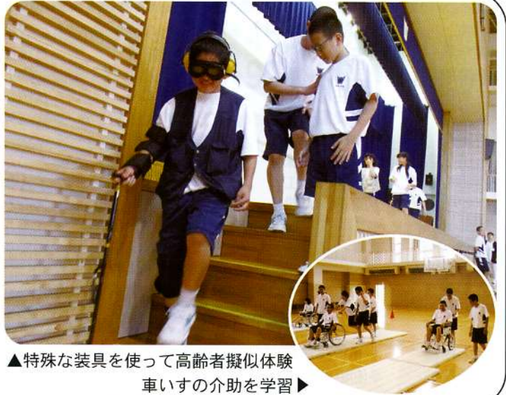
▲特殊な装具を使って高齢者擬似体験 車いすの介助を学習▶

不自由さを実感するのは難しいことだったと思いますが、これを機会に少しでも福祉のことや障がいのある方への理解を深めるきっかけとなってくれればと思います。