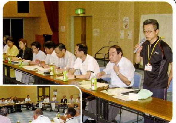
◀金浦会場での 開催の様子

今回は参加者同士による懇談がメインに行われ、参加された皆さんは自分たちの地域の課題や取り組み、集落サロンなどについて発表され、活発な情報交換が行われました。