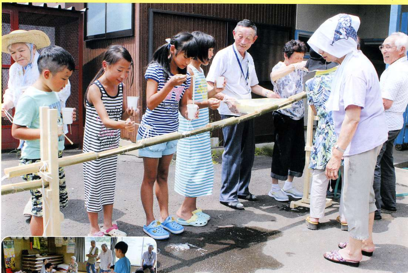
▲おいしそうな「流しそうめん」に思わず笑みもこぼれます