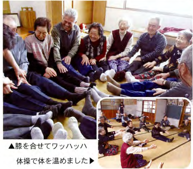
▲膝を合せてワッハッハ 体操で体を温めました▶

「雪国健康づくり交流会」は、赤い羽根共同募金配分金の一部を活用して開催しております。