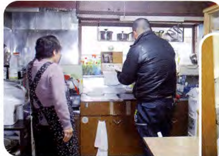
▲ご家庭の水まわりをチェック