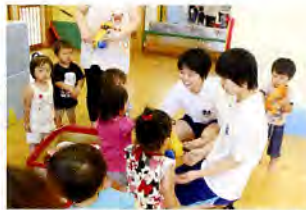
▲サマーボランティアスクール