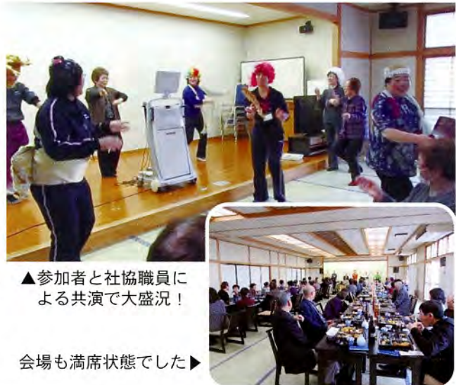
▲参加者と社協職員による共演で大盛況!