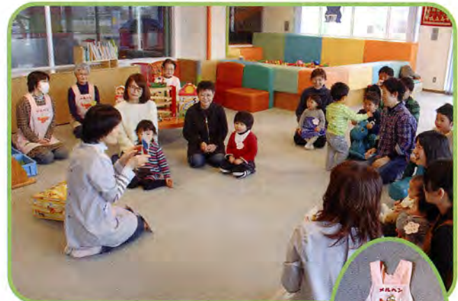
▲おもちゃライブラリーきしゃぼっぽでの一コマ

年2回の「すくすく教室」は保健師さんによる子どもの健康に関するお話、そして子育て支援の先生による体操・手遊び・絵本・歌などみんなで楽しんでいます。