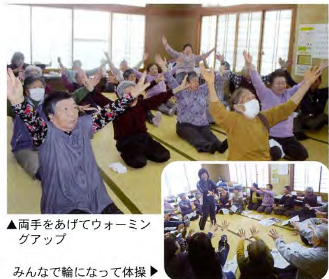
▲両手をあげてウォーミングアップ

「ふれあいサロン交流会」は、赤い羽根共同募金配分金の一部を活用して開催しております。