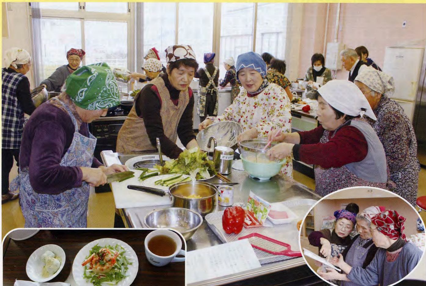
▲ただいま作戦会議中