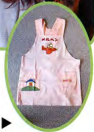
会員おそろいのエプロンです▶