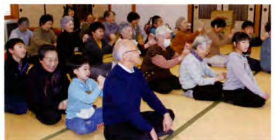
▲ 杉山自治会での様子 (H30.1.10)