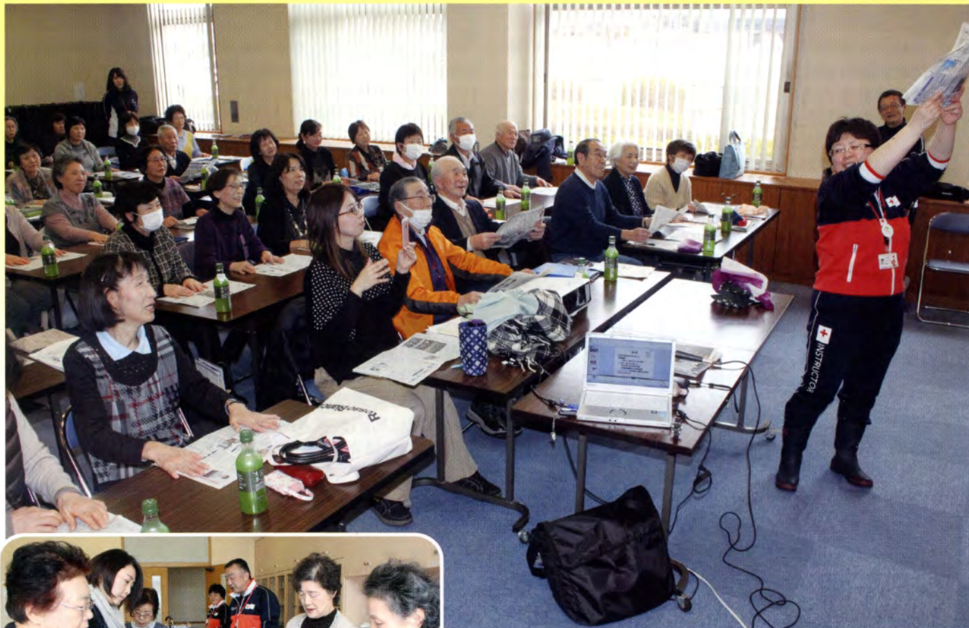
▲新聞紙を使った入れ物の作り方を教えていただきました。災害時にスリッパとしても活用できます。