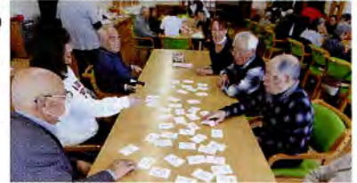
▲通所介護事業 レクリエーション・言葉探し ゲームの様子（H30.3.15）