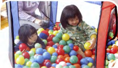
▲目の前のロディとらめっこ