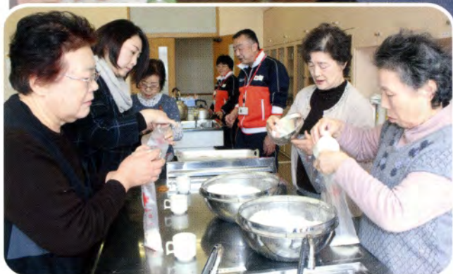
▲炊き出し用の耐熱袋に米をつめている様子。これを袋ごと熱湯の鍋にいれ30分煮ます。