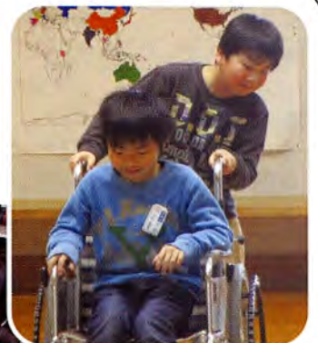
▲教えてもらった方法で車椅子を操作しています（平沢小学校）