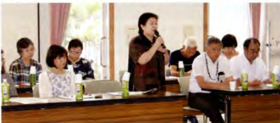
▲ 上浜・上郷地区合同懇談会の様子 (H29.7.13)