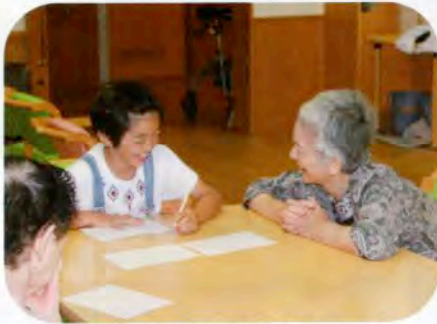
▲「〇ん〇ん」に当てはまる言葉を探すゲームをしました。(にかほ市デイサービスセンター)