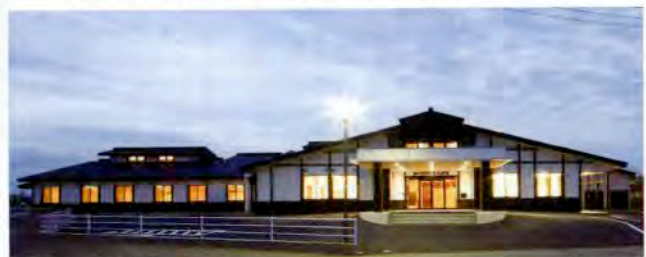
▲照明を照らした外観