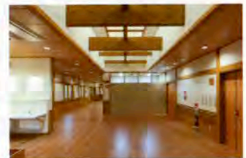
▲施設内は、秋田杉の温もりが感じられます