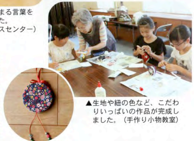
▲生地や紐の色など、こだわりいっぱいの作品が完成しました。(手作り小物教室)

ボランティアをお引き受けいただいた社会福祉施設や団体の皆様に、心よりお礼申し上げます。