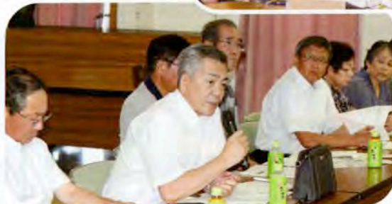
▲地域の実情について活発な意見が出されました