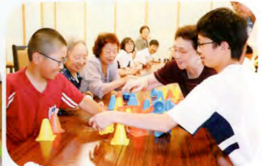
▲一緒にゲームを楽しみました。(ミニデイサービス)