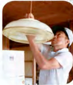
◀ なかなか掃除の出来ない電気の笠もピカピカに…