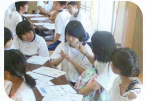
▲手話で自己紹介に挑戦しました。(手話教室)