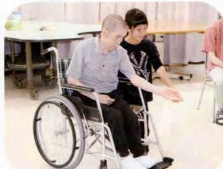
▲ゲームのお手伝いをしました。(金浦療護園)