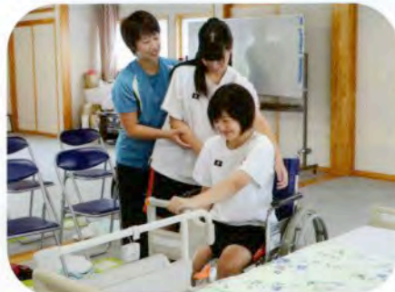
▲社協職員から介助の仕方を学びました。(福祉体験)

今年も市内の小学5・6年生と中学生を対象とした「サマーボランティアスクール」を開催しました。参加された児童・生徒の皆さんは高齢者や小さな子ども達とふれ合ったり、折り紙や小物作りに挑戦したり、手話を学んだりとさまざまなことに取り組みました。