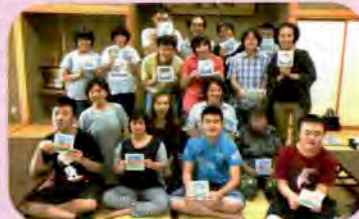
▲「なかよし交流会」の様子 (にかほ市手をつなぐ育成会)