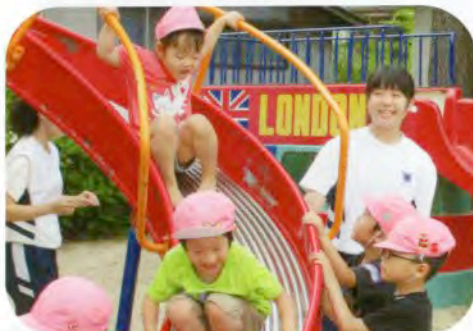
▲さまざまな遊びで子ども達とふれあいました。(白百合こども園)