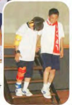
▶「あと一段」声かけが大切です