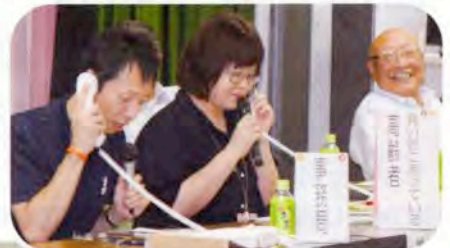
▲買い物弱者からの依頼に対応している寸劇の様子

7月23日（月）は元町地区、26日（木）は上浜・上郷地区を対象に行いました。当日は社協の地域福祉事業の紹介をした後、にかほ市地域包括支援センターより「生活支援体制整備事業」についてお話していただきました。寸劇を組み込んだ説明は大変分かりやすく、事業の概要を知ることができたと大変好評でした。