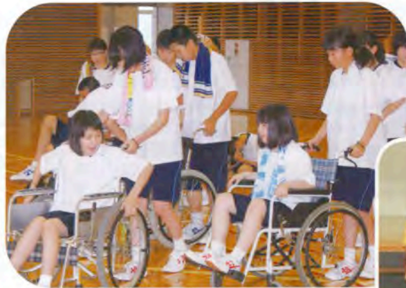
▲車いす介助に挑戦！

7月13日（金）仁賀保中学校の依頼により社協職員が講師となって1年生82名を対象とした福祉体験教室を開催しました。車いす体験、重りやサポーターを着けて行う高齢者や障がい者の疑似体験、目隠しをしたまま歩行するブラインドウォークの3つの体験メニューをクラスごとに分かれて行いました。どのメニューも「声かけ」が重要でしたが、生徒の皆さんはしっかりと意識して行っていました。今回の体験をきっかけに介護や福祉への理解や興味を持ってもらえたらと思います。