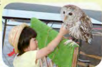
▲前回の様子。こんなに近くでふれあう事ができます。

※ 寒さに弱い動物が多いため屋内での開催になりますので、今回は入場制限や時間制限を設けます。若干お待ちいただくことがあるかもしれません。予めご了承下さい。