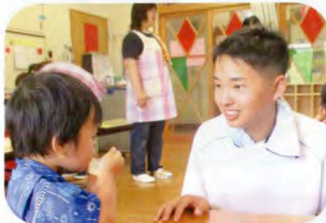
▲夏祭りのお手伝いをしました。(にかほ保育園)