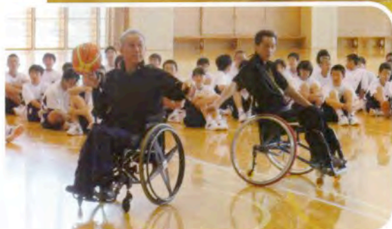
▲▶車いすに乗ったままシュートをしたりミニゲームを通して体験しました