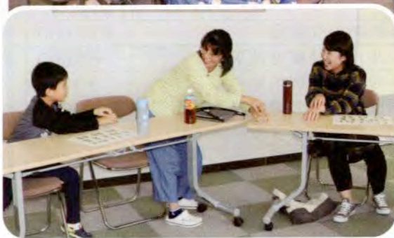
▲上手く伝わるかな…？