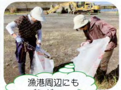
漁港周辺にも ゴミが…