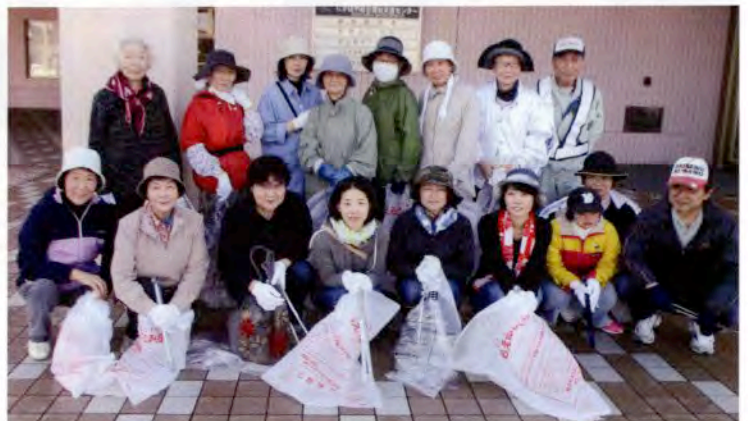
▲仁賀保地域へ参加した皆さん