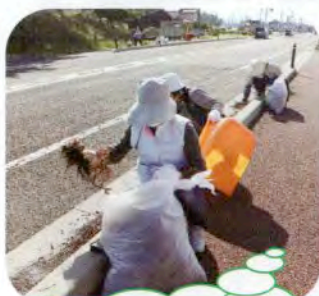
あっという間に ゴミ袋が いっぱい…