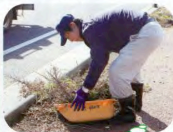
縁石の脇の 除草作業