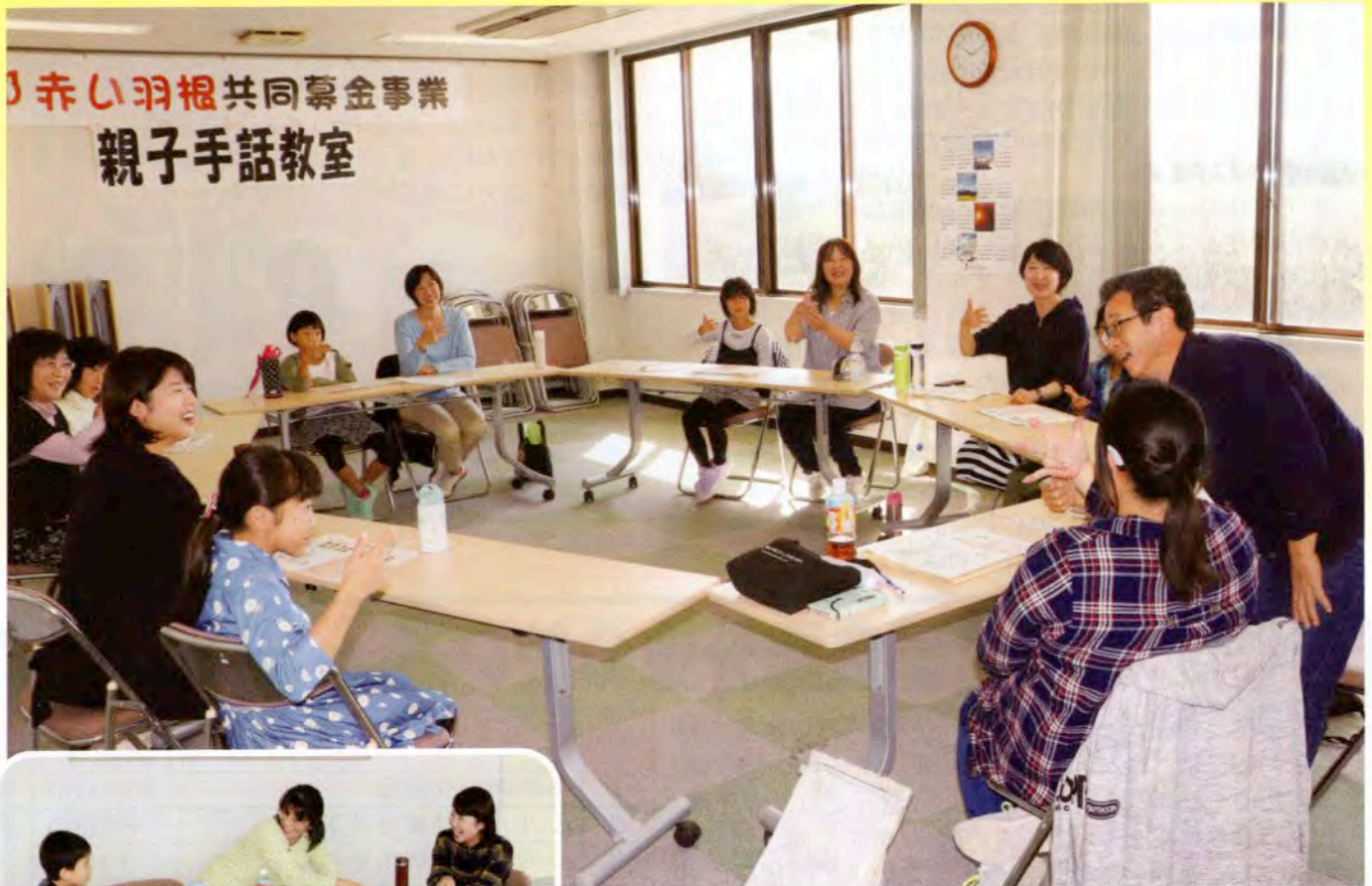
▲手話は表情もとても大事！