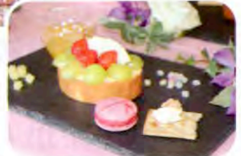
▲ 食べるのがもったいない!