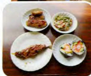
▲ 彩りもよい料理が完成しました!