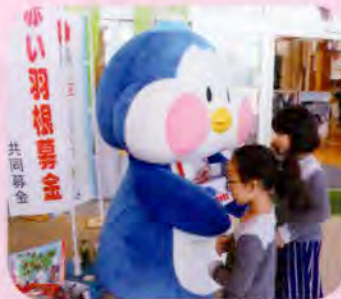
▲大人気のかかほっぺん

秋田県共同募金会よりあきた応援ご当地キャラクター隊員に任命されている「にかほっぺん」も登場して社協職員が募金を呼びかけ、8,226円の募金が集まりました。皆様のご協力に感謝申し上げます。