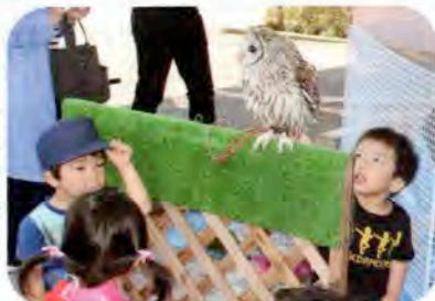
(6/3 移動動物園の様子)

普段触れ合う機会がない珍しい動物を集めて、家族と一緒に実際に触ったり、抱っこしたりして、楽しむ機会を提供しました。