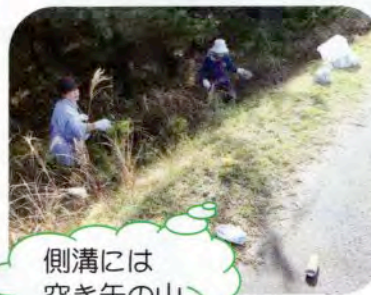
側溝には 空き缶の山