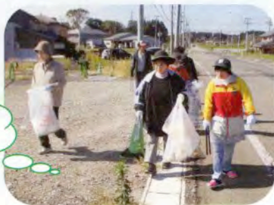
道路沿いの ゴミ拾い