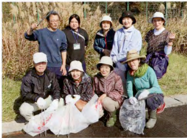
▲金浦地域へ参加した皆さん