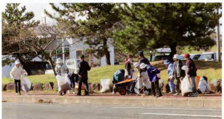
▲象潟地域の活動の様子