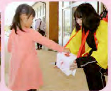
▲ありがとうございます