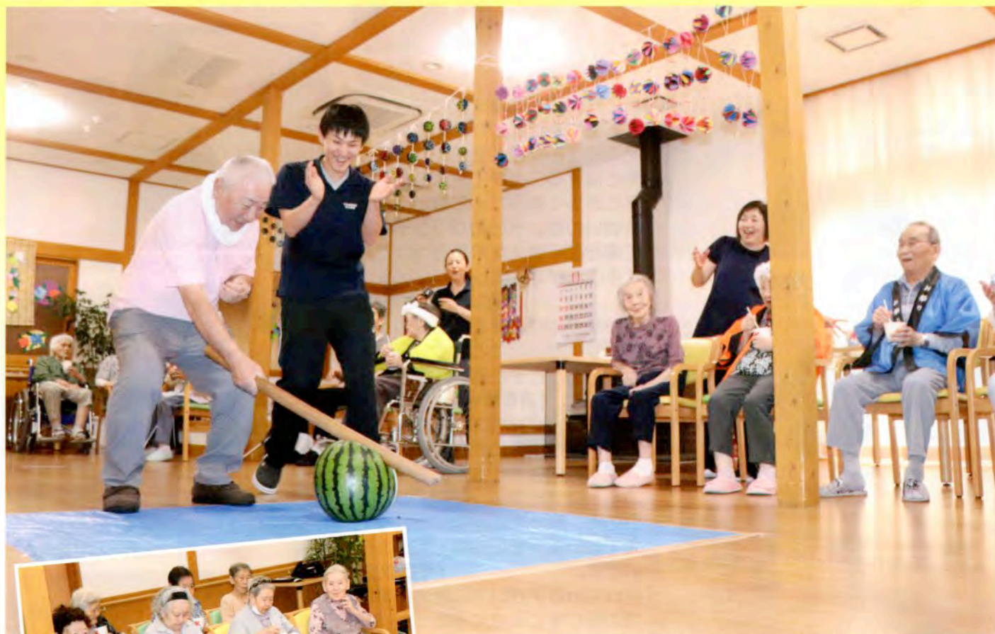
▲見事命中！！ 会場には「おお～」という歓声が響きました。