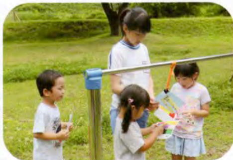
▲「シール見つけた！」 (明星保育園)