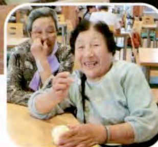
▶おいしくて思わずにっこり♪