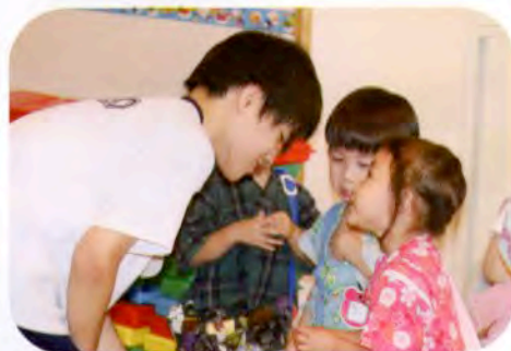
▲目線を合わせて… (にかほ保育園)