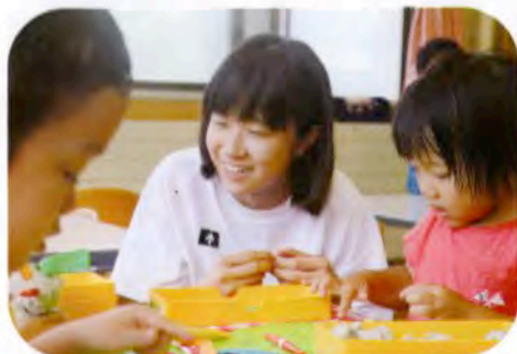
▲粘土で何を作ろうかな？ (勢至保育園)