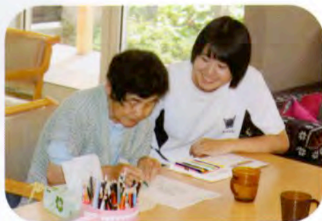
▲お花のぬり絵に挑戦！ (ティサービスわかば武道島)