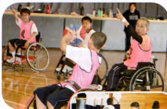
▲シュート、決まるかな？

競技用の車いすは普通の車いすとは違った形をしていて、初めのうちは恐る恐る乗っていた生徒たちでしたが、しばらくするとドリブルやシュートにも積極的に挑戦していました。車いすに乗った状態で自由に動くことの難しさや大変さを理解することが出来たこの体験は、生徒たちにとって障がいに対する理解を深める良い機会となったのではないのでしょうか。