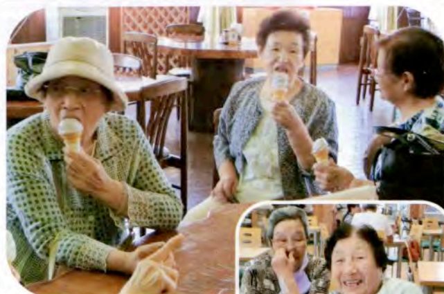
▲冷たいソフトクリームでリフレッシュ！

※「総合事業生活機能向上サービス(ミニデイサービス)」は、にかほ市からの委託を受けて行っております。