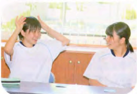
▲何の動物でしょう？ (手話教室)