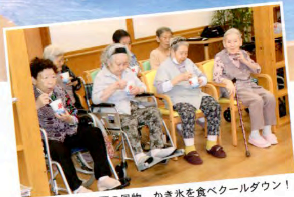
▲もう一つの夏の風物、かき氷を食べクールダウン！