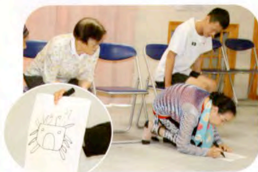
▲チームに分かれてお絵描きゲーム！ (ミニティサービス)

ボランティアをお引き受けいただいた社会福祉施設や団体の皆様に、心よりお礼申し上げます。