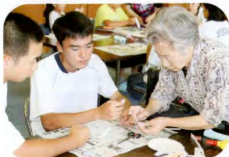
▲男子も頑張りました！ (手作り小物教室)