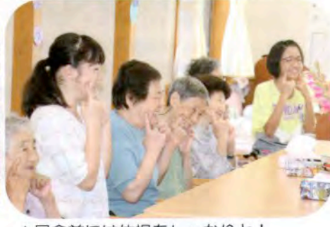
▲昼食前には体操をしっかりと！ (にかほ市ティサービスセンター)