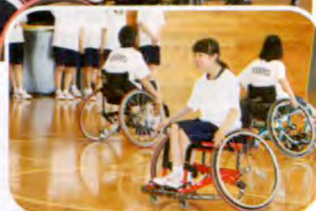
▶難しいけど面白い！