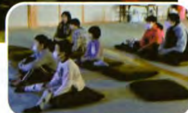
▲スクリーンにくぎ付けです