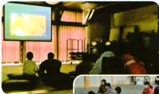
▲劇中歌も素晴らしかったです

今回上映した映画は「リメンバー・ミー」。残念ながら参加者はインフルエンザ発症により7名と申込時よりも少なかったものの、“家族”“愛”“夢”をテーマに繰り広げられる内容に、笑いあり感動ありの映画鑑賞となりました。