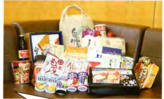
集まった食料品の一部です。お米は、全部で360kgも集まりました。

経済的な事情などで食事に不自由されている方々やそうした方々を支援している団体などへ提供されます。運動にご協力いただいた皆様に心よりお礼申し上げます。