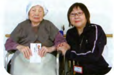
▲特別養護老人ホーム「陽光苑」さんへ