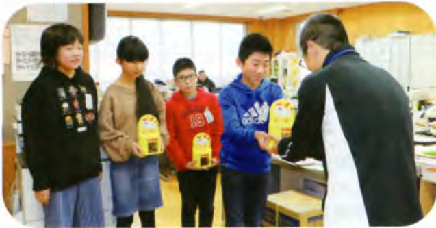
▲12/5、金浦小学校運営委員会の児童の皆さんより、募金箱をお預かりしました

皆様よりご協力いただきました「赤い羽根共同募金」は一旦全額を秋田県共同募金会へ送金します。そして翌年度約75%がにかほ市共同募金委員会（にかほ市社会福祉協議会）へ還元され、高齢者や子どもを支える事業や地域を支える活動、ボランティア活動等に役立てられます。残りの約25%は、大規模災害に備えた積立金や県内の様々な福祉団体等の活動に役立てられます。