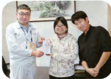
▲障がい者就労支援施設「ほっこり草の里」さんへ