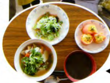
◀色どりもバッチリ!