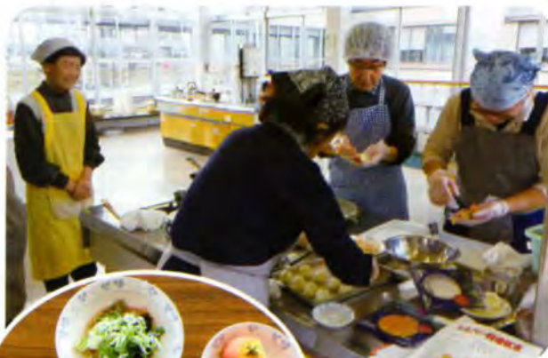
▲器用にくるくる巻いて…

今回は、牛肉や野菜をふだんに使った「具だくさん肉雑煮」、椿の花のような「ポテトのサーモン巻き」、ごま油が香ばしい「ねぎと貝柱のサラダ」と胡麻を使った「胡麻しるこ」の4品に挑戦しました。どのメニューも簡単なのにいつもとちょっと違った雰囲気レシピで、「とてもきれい!」「今年のお正月に作ってみたい」などと参加者の皆さんの会話も弾んでいました。