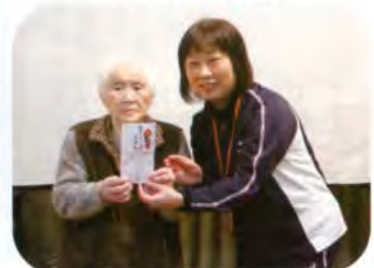
▲「デイサービスわかば武道島」さんへ