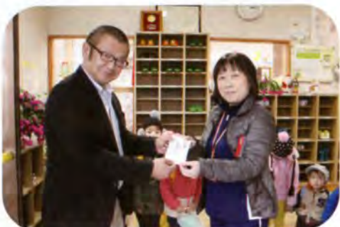
▲「ひまわり保育園」さんへ