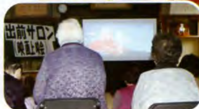
▲久しぶりに顔を合わせる方もいたようです