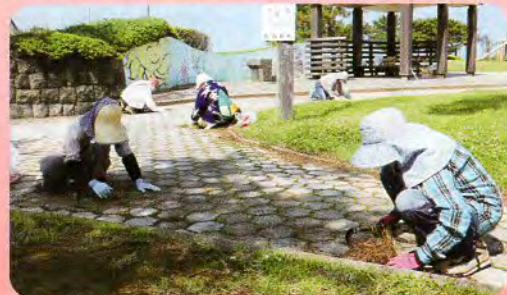
▲奉仕活動として潮風公園の草むしりを実施(にかほ市仁賀保赤十字奉仕団)