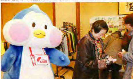
▲ミニバザーに「にかほっぺん」が登場！

事業名・にかほ市「ボランティアまつり」 にかほ市内のボランティア団体及びボランティアに関心を持つ市民に広く呼びかけ、会員の活動紹介をはじめ、ミニ講演会や芸能発表を鑑賞し交流を図った。