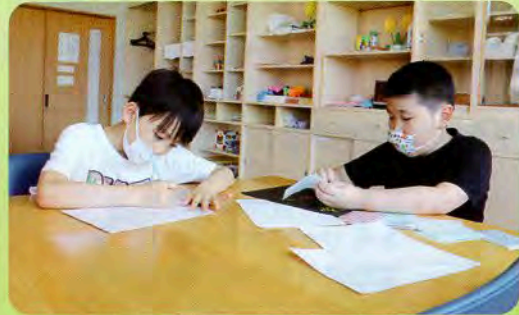
▲大好きなお絵書きとシール貼りに夢中!!