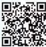
▲にかほ市ネット募金 ページQRコード

中央共同募金会のインターネットを通じた募金からにかほ市を指定して募金ができます。