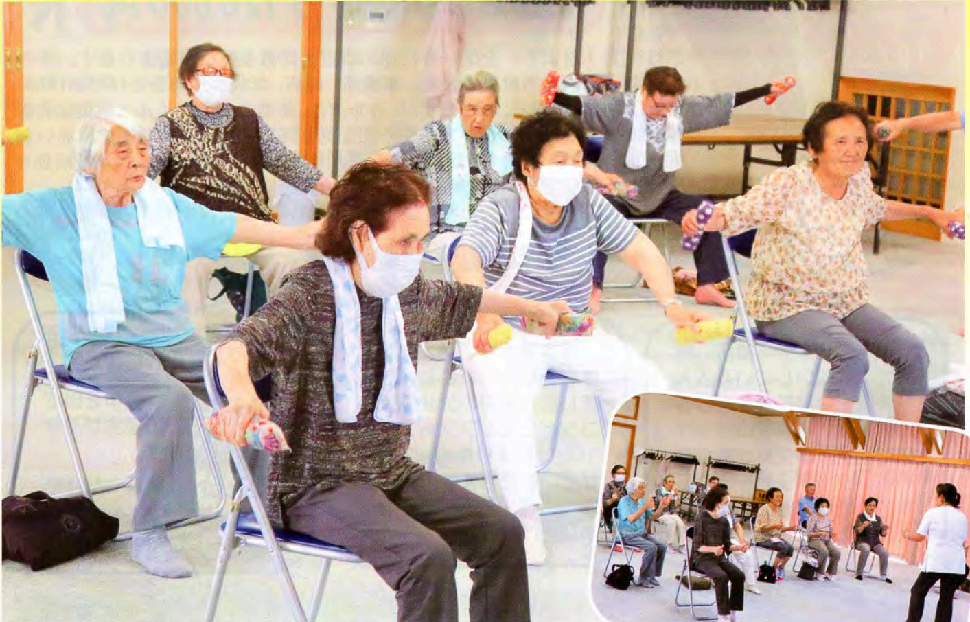
▲程よい重みの玄米ダンベル、さまざまな使い方が出来ますよ