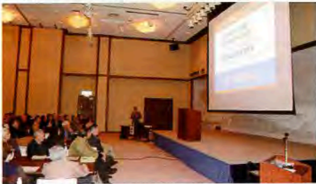
▲本荘由利地区手をつなぐ育成会合同交流研修会

事業名・なかよし交流会 ・ 会員交流会 ・ 青空会 ・ 知的障害団体研修会 等 知的障がいのある方や家族が交流し、お互いを理解し、生活の質を高め、地域で共存出来る社会になるように支援者との交流や研修による情報の共有化を図った。