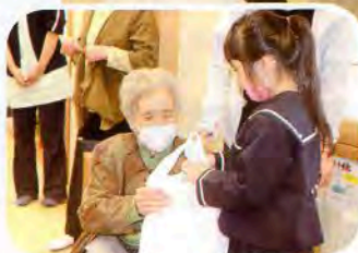
◀一人ひとりにプレゼントを頂きました