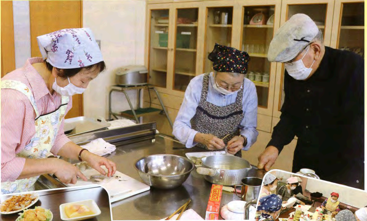
▲手際よく下ごしらえをしています