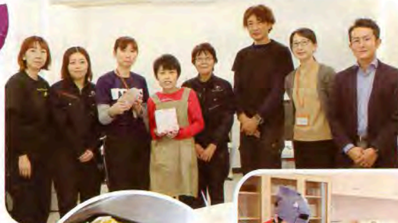
◀株式会社秋田マテリアルの皆さんと記念撮影

※「ニカッとHOTクラブ」は、にかほ市総合生活相談室で関わっている方々を対象に実施している調理実習や製作活動などの取り組みです。