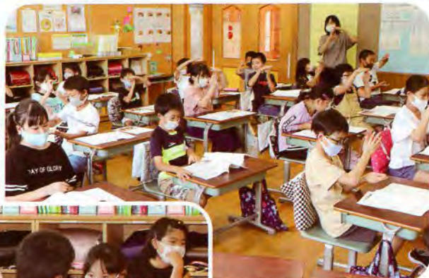
▲皆で一緒に覚えよう!

9月14日(月)金浦小学校4年生を対象に手話教室を開催しました。決められた時間の中で伝えられる事は限られてしまいますが、まずは自分の「苗字」の手話を覚えてもらいました。資料や講師のお手本を真剣に見て学び、手の動きの意味を理解しながら挑戦していました。その後に行ったジェスチャーゲームは、身振り手振りで伝えるのは思った以上に難しかったようですが「もう一回やりたい!」と声上がる程に盛り上がっていました。元気いっぱいの笑顔で楽しみながら学んでくれた児童の皆さん、この体験を通じて手話への興味がさらに増したのではないのでしょうか?