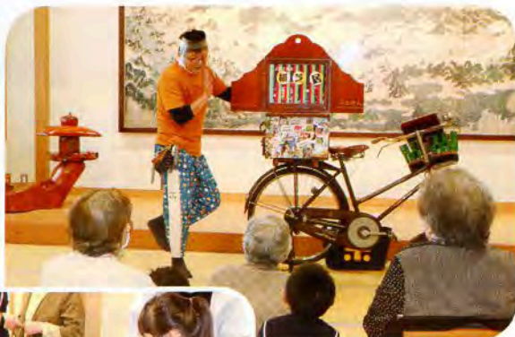
▲個性的なよねさん

※「総合事業生活機能向上サービス」(ミニデイサービス)は、にかほ市からの委託を受けて行っております。