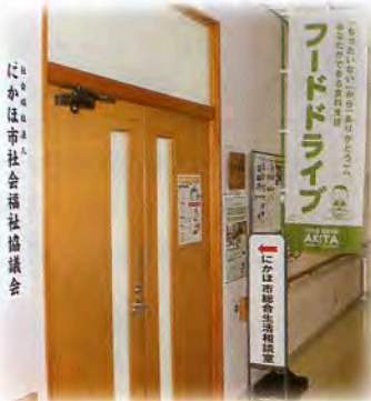
にかほ市社会福祉協議会

まだ食べられる食料品を捨てていませんか？ ご家庭に眠っている食料品を募集しています！