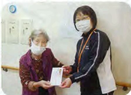
▲グループホーム元瀧荘へ