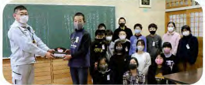
▲12月16日(水) 平沢小学校児童会本部の皆様より募金箱をお預かりしました

皆様よりご協力いただきました「赤い羽根共同募金」は一旦全額を秋田県共同募金会へ送金します。そして翌年度約75%がにかほ市共同募金委員会（にかほ市社会福祉協議会）へ還元され、高齢者や子どもを支える事業や地域を支える活動、ボランティア活動等に役立てられます。残りの約25%は、大規模災害に備えた積立金や県内の様々な福祉団体等の活動に役立てられます。