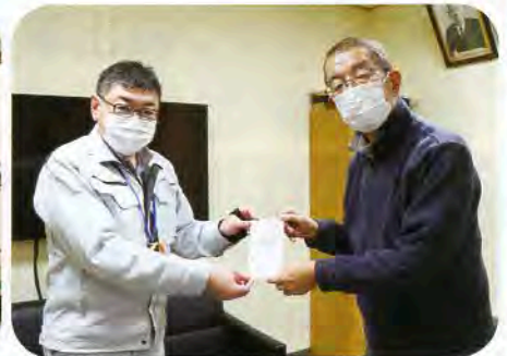
▲学校法人 仁賀保幼稚園 幼保連携型認定子ども園仁賀保へ