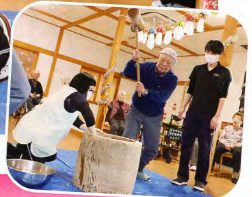
▲「よいしょ!! よいしょ!!」ついたお餅は鏡餅として飾りました