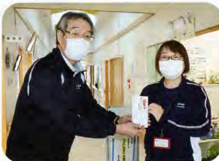
▲社会福祉法人 仁賀保中央福祉会 障害者支援施設 金浦療護園へ