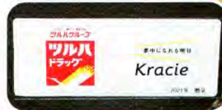
▲側面に会社名が入っています

この度、(株)ツルハホールディングス様、クラシエホールディングス様より、車椅子1台が寄贈されました。この車椅子は、福祉交流施設たんぼぼで活用させていただいております。どうもありがとうございました。