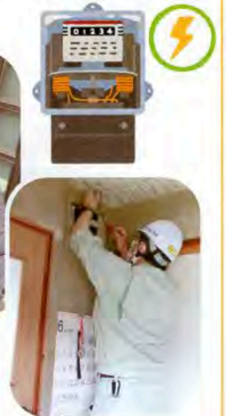
▶ブレーカーもしっかり確認!