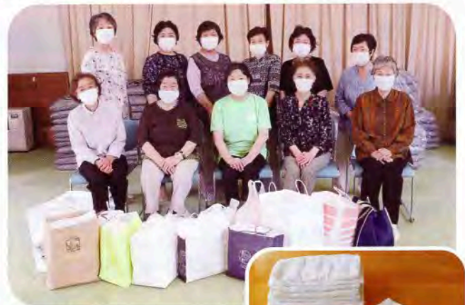
▲▶女性部役員の皆さん(上)と手縫いタオル(右)

にかほ市老人クラブ連合会仁賀保支部女性部より、手縫いタオル等を525枚ご寄付いただきました。これは、女性部の奉仕活動として長年取り組んでいるものです。毎年、ご寄付いただいた手縫いタオルは、仁賀保地域の福祉施設や小中学校、保育施設、公共施設等へお届けしております。会員の皆様のあたたかいご厚意にお礼申し上げます。どうもありがとうございました。