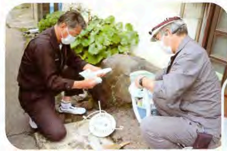
▲丁寧に汚れを取り除きます

訪問先では、高い位置にあり手が届きにくく、なかなか掃除が出来ない電気の笠をピカピカに洗っていただいたことで「部屋の中が明るくなった」と喜んで見られました。ねむの会の皆さん、本当にありがとうございました。