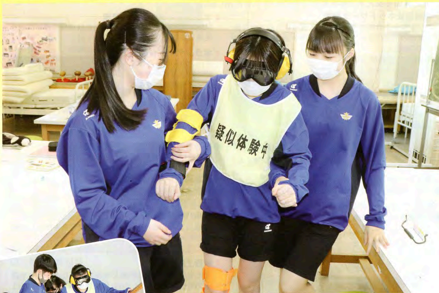
▲目が見えづらいと歩くのも大変！