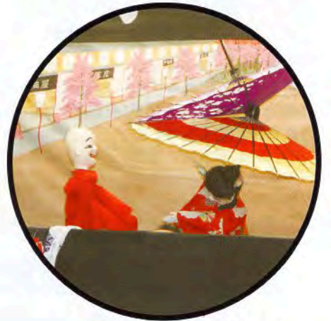
かんてつぼう かさおど ▲鑑鉄坊さんの傘踊り