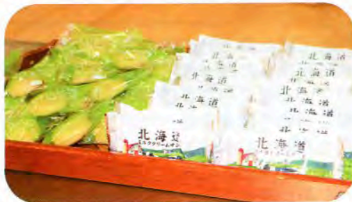
▲この日のおやつは北海道！