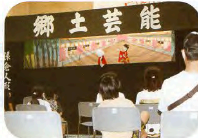
▲まるで生きているみたい！