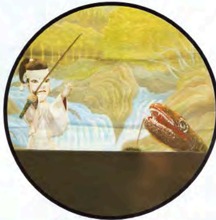
いわみじゅうたろう だいじゃたいじ ▲岩見重太郎 大蛇退治