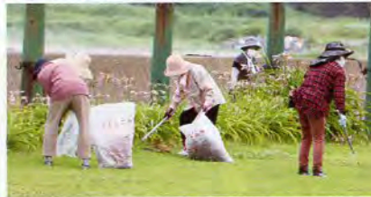
▲潮風公園奉仕活動の様子 (にかほ市仁賀保赤十字奉仕団)