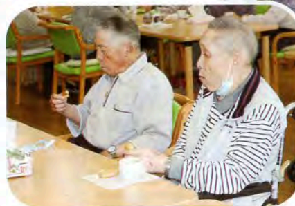
▲じっくり味わっていただきました