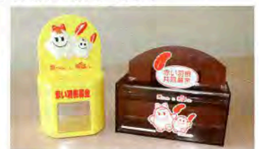
▲この募金箱を見つけたらご協力を…

市内の公共施設やコンビニエンスストア、スーパー、食堂等に募金箱を置かせていただいております。ご協力よろしくお願い致します。