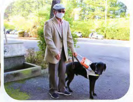
▲ハーネスを着けたらお仕事モード！