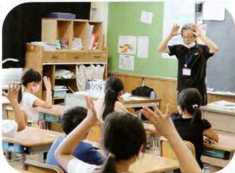
▲これは何を表しているでしょう？