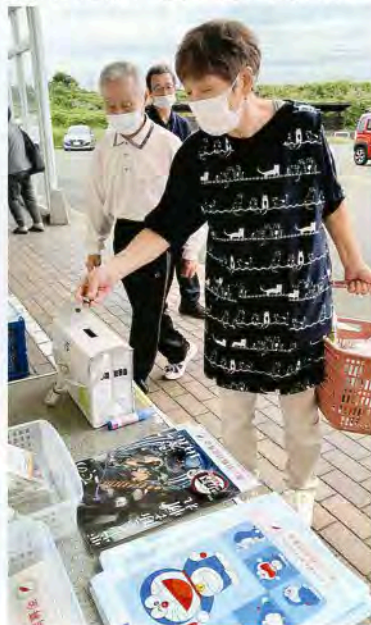
▲マックスバリュ金浦店にて