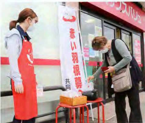
▲マックスバリュ武道島店にて