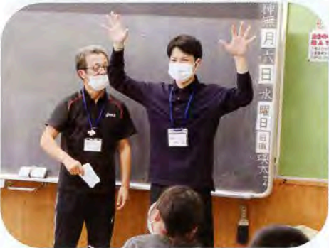
▲ジェスチャーゲームにも参加！