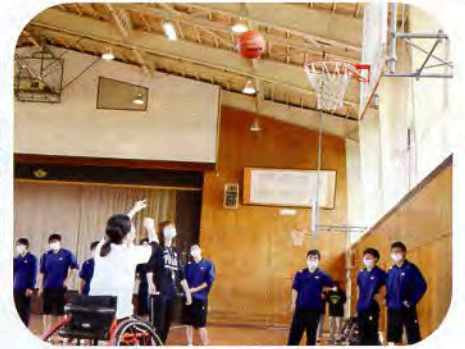
▲車いすバスケットに挑戦