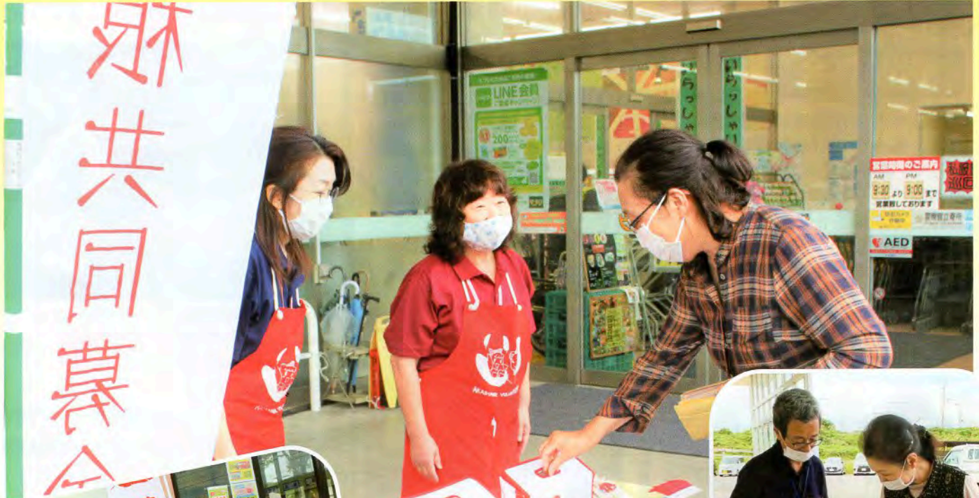
▲設置した募金箱を見つけて、沢山の人がご協力してくださりました