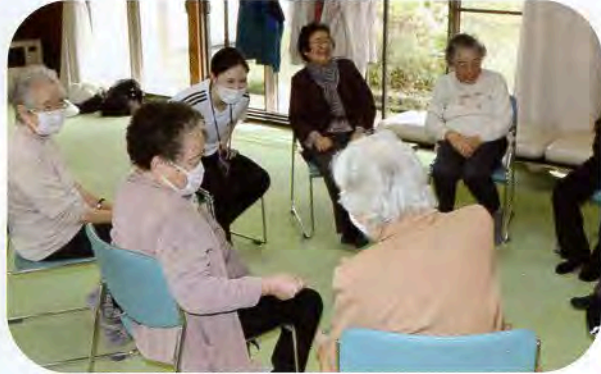
▲じゃんけんゲームで大笑い！