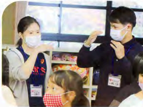
▲平沢小学校「手話クラブ」にて体験