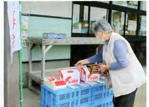
▲JA物産所百彩館にて