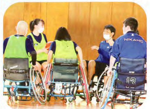
▲男子対女子で試合！結果は…？