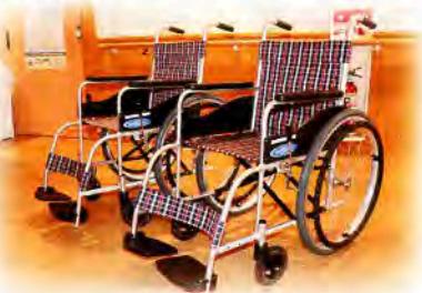
▲いただいた自走式車椅子2台

この度、「秋田県遊技業協同組合」様より、車椅子2台が寄贈されました。いただいた車椅子は、福祉交流施設たんぼほで、ショートステイやデイサービスで利用者の移動介助の際活用させていただいております。どうもありがとうございました。