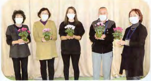
▲完成した苔玉と一緒に記念撮影!