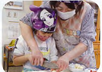
▲こうやって押さえながら…