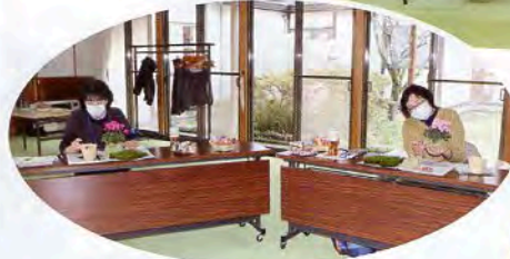
▲苗を包むように苔を巻きつけます