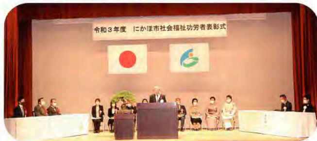
▲式典にて会長挨拶の様子

11月19日(金)仁賀保勤労青少年ホームにて、「令和3年度にかほ市社会福祉功労者表彰式」を開催しました。昨年度予定しておりました、にかほ市社会福祉大会が新型コロナウイルス感染症の影響により実施できなかったため翌年に持ち越され、今年度の開催となりました。本来であれば、市民の皆様や関係者の方々にお声をかけ、盛大に執り行いたい式典でござい