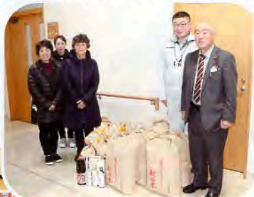
▲「にかほ市農業委員会」の皆様からは、お米と食料品をご寄付いただきました