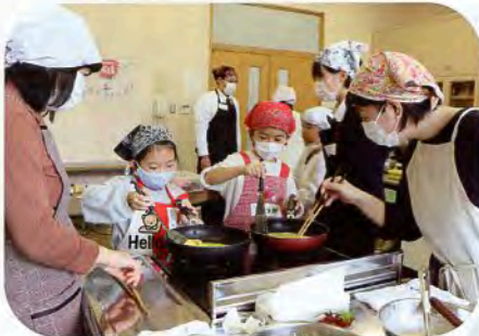
▲焼き具合はどうか?