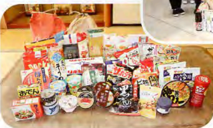
▲お米やお菓子、缶詰等…沢山のご寄付をいただきました