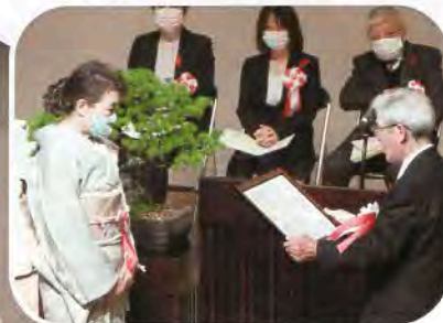
▲出席された方々、一人ひとりに表彰状や感謝状が授与されました