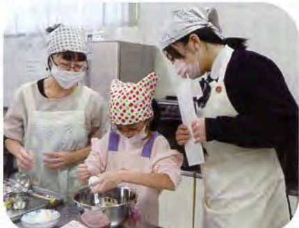
▲うまく割れるかドキドキ…!

11月21日(日)、27日(土)、28日(日)の3日間、3つの地域に分かれてにかほ市内の小学生とその保護者を対象に「親子料理教室」を開催しました。講師には仁賀保高等学校クッキングクラブ(NCC)の生徒の皆さんをお招きし、米粉クレープと米粉カスタードクリームを作りました。終始和気あいあいとした雰囲気の中で楽しく調理する様子を写真と共にご紹介します。