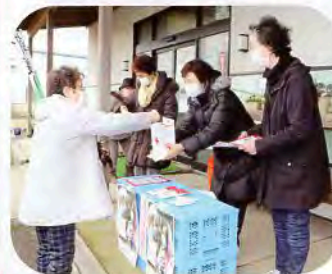
▲「JA物産所百彩館」にて

日本赤十字社では、12月1日から12月25日まで全国的に「NHK海外たすけあい」キャンペーンを実施しました。秋田県支部では「全県一斉街頭募金活動」を実施することとなり、にかほ市でも赤十字奉仕団員が街頭に立ち募金を呼びかけました。NHK海外たすけあいは、NHKと日本赤十字社が共同で行っており、集まった募金は突発的な災害や紛争等で苦しむ人々を救うために活用されています。昨年はコロナの影響で実施できませんでしたが今年は感染が落ち着いてきたため、実施する運びとなりました。短時間ではありましたが、多くの方々よりご協力いただき、どうもありがとうございました。