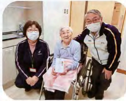
▲「特別養護老人ホーム浩寿苑」へ