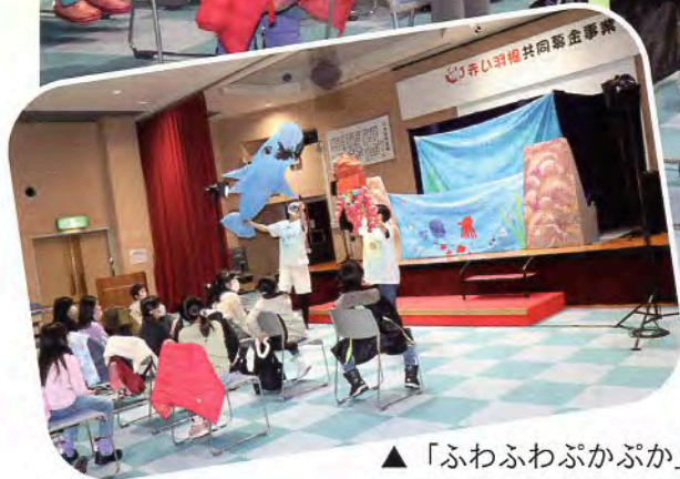
▲「ふわふわぶかぶか」では、「ポイ捨て禁止」を海の中の様子を通して伝えてくれました