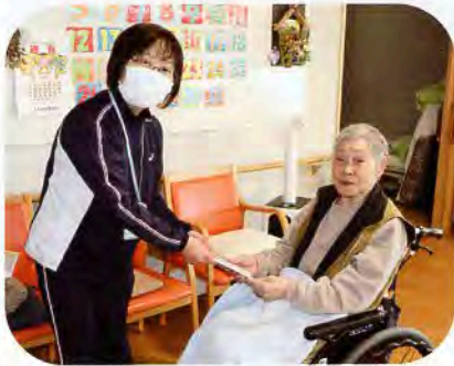
▲「デイサービスセンター合歓」へ