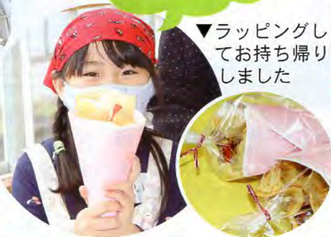
▼ラッピングしてお持ち帰りました