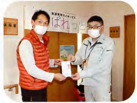
▲「放課後等デイサービスぱれっと」へ