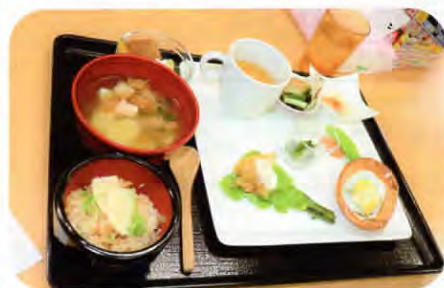
▲さまざまな料理を少しずつ…