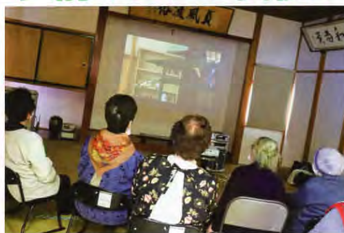
▲震災時の事を思い出しながら…