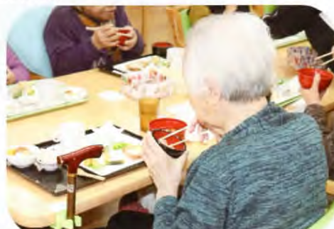
▲おいしいね、と声が聞こえます