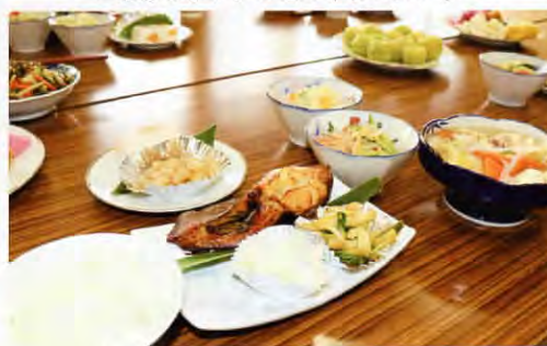
▲ご馳走がずらりと並びました