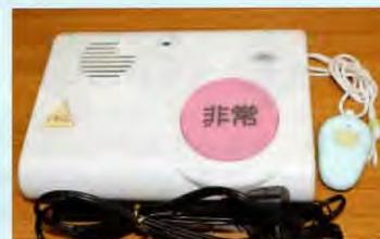
▲緊急通報システム