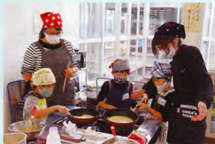
▲「親子料理教室」の様子