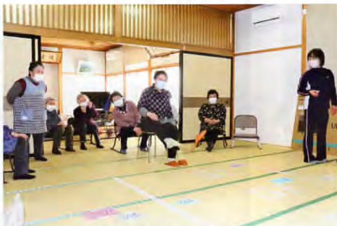
▲高得点を狙います！