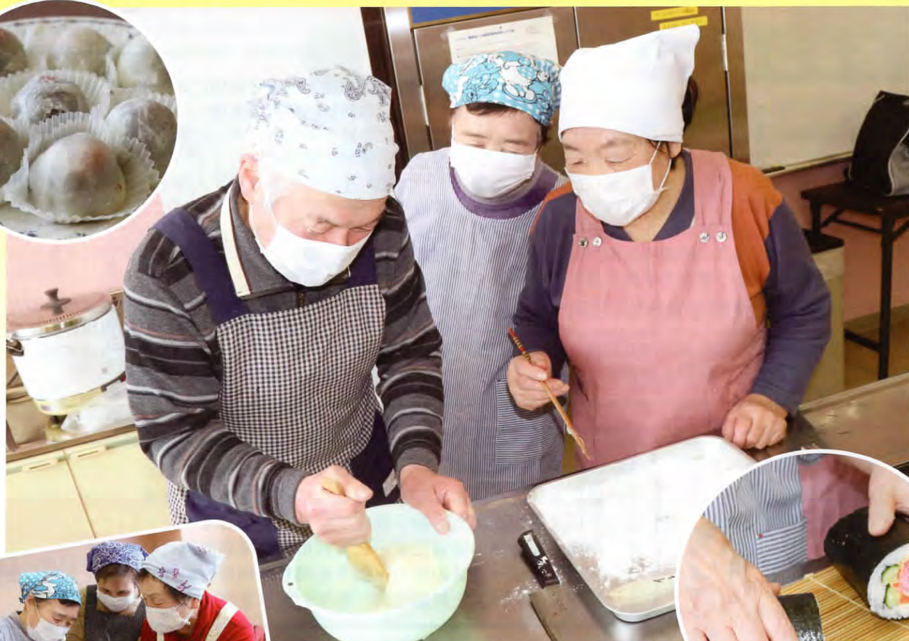
▲男性も活躍しました！