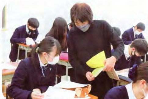
▲講師にアドバイスをもらいながら…