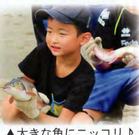
▲大きな魚にニコリ♪