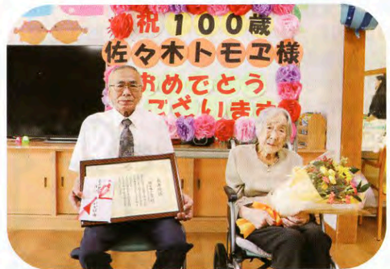
▲にかほ市から長寿祝状と祝金をいただきました