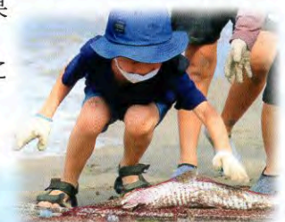
▲おそろおそろ触ってみます…