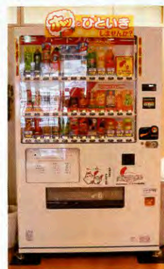
▲福祉交流施設たんぼぼにも設置しています

赤い羽根自動販売機は商品購入の際、売り上げの一部を募金できる販売機です。にかほ市内にも4ヶ所に設置されているので探してみてくださいね。見かけた際は、ご協力よろしくお願い致します。