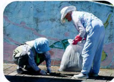
▲潮風公園奉仕活動の様子(にかほ市仁賀保赤十字奉仕団)