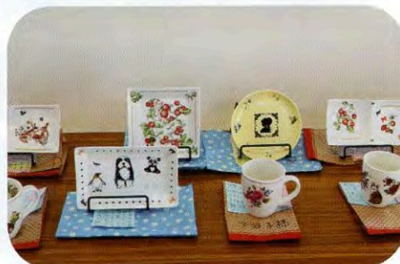
◀前回のサロンで皆さんが作った「ポーセラーツ」の作品も飾られていました！