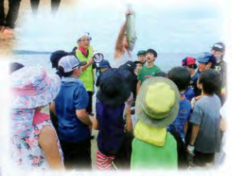
▲この魚は何でしょう?