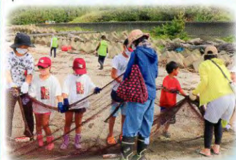
▲はじめて触る網に興味津々?