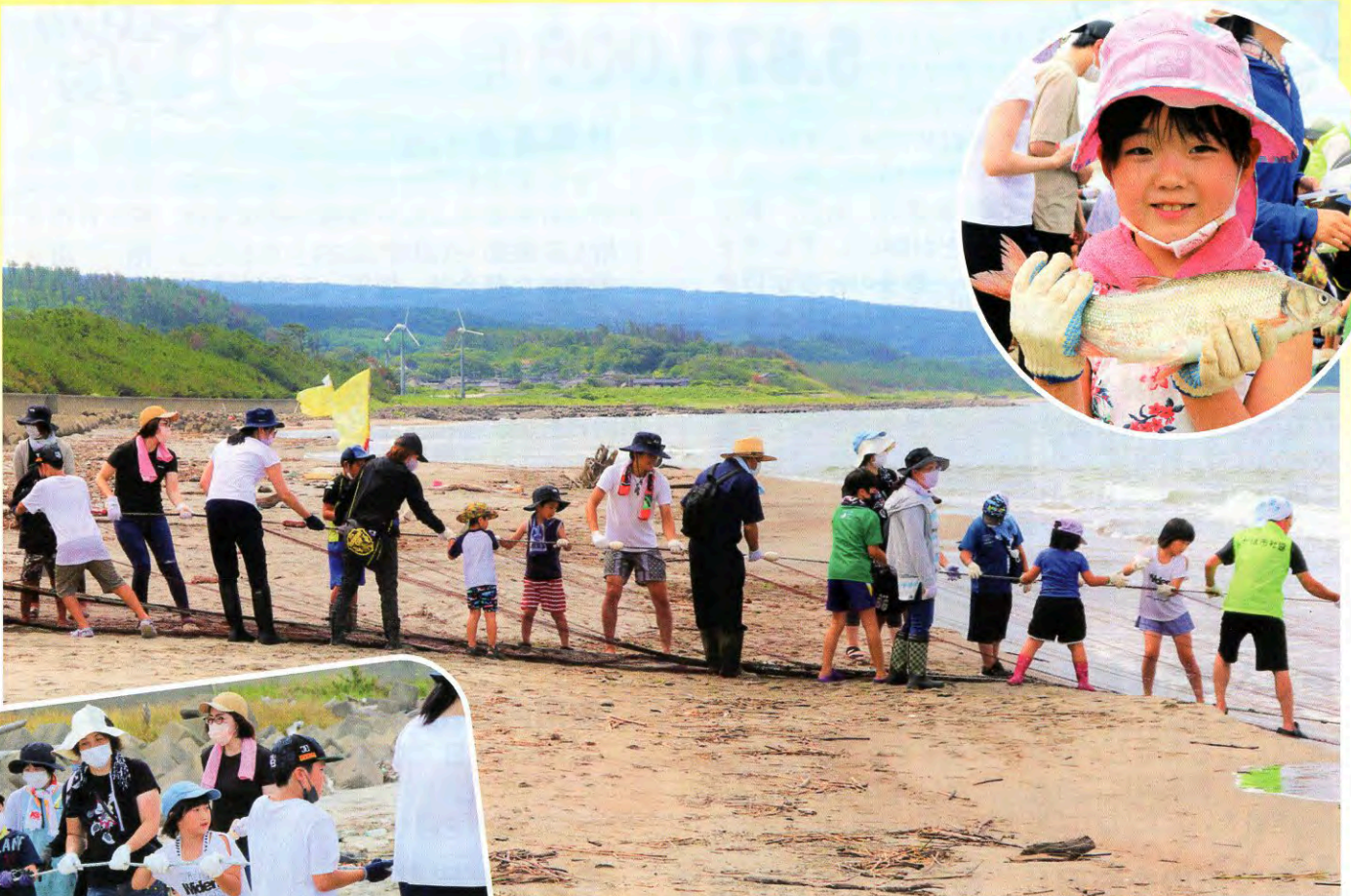
▲大人と子ども、力を合わせて引っ張ります！