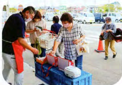
▲ビフレにかほ店にて