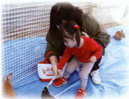
▲エサやり体験も出来ました！