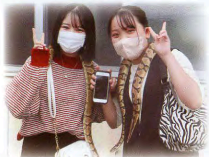
▲ヘビを首に巻いてにっこり♪