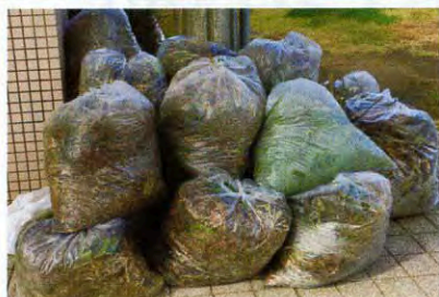
▲こんなにたくさんの草が集まりました！