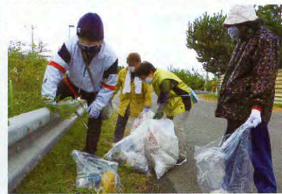
▲草むらに隠れたごみも拾います