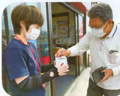
▲マックスバリュ武道島店にて

買い物に訪れたお客さんが足を止め、快く募金にご協力くださいました。どうもありがとうございました。また、募金活動場所を提供して下さった各店舗にも心より感謝申し上げます。