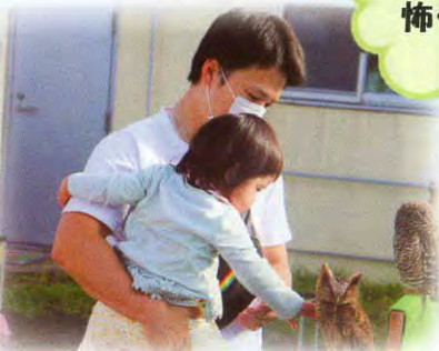
▲そーっと撫でてあげました