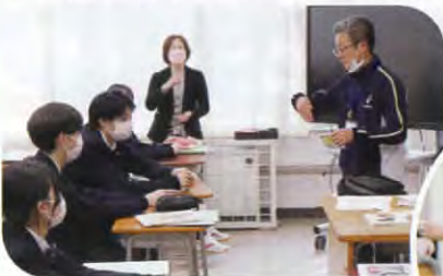
◀講師の手本を真剣に見つめています

仁賀保高校の2年生を対象に、社協職員が講師となり福祉体験教室を行いました。11月16日(水)に手話、30日(水)に点字の体験を行いました。真剣な眼差しで授業に取り組む生徒の皆さん。これを機会に福祉を身近に感じてもらえたら…と思います。