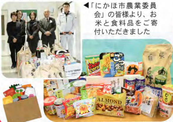
◀「にかほ市農業委員会」の皆様より、お米と食料品をご寄付いただきました

ご寄付いただいた食料品は12月20日に「一般社団法人フードバンクあきた」へお届けし、経済的な事情などで食費の確保に不自由されている世帯やそうした方々を支援している団体などへ提供されます。運動にご協力いただいた皆様に、心からお礼申し上げます。