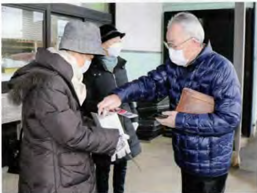
▲「JA 物産所百彩館」にて

「NHK海外たすけあい募金」とは、日本赤十字社とNHKが毎年12月に実施している募金キャンペーンです。それに合わせてにかほ市でも日赤奉仕団員が街頭に立ち、募金を呼びかけました。今回集まった募金は、世界各地で紛争や自然災害、病気、食料危機などに苦しむ方々を救うために活用されています。快く募金にご協力してくださいました多くの皆さまと、募金活動場所を提供してくださった各店舗さまに、心より感謝申し上げます。