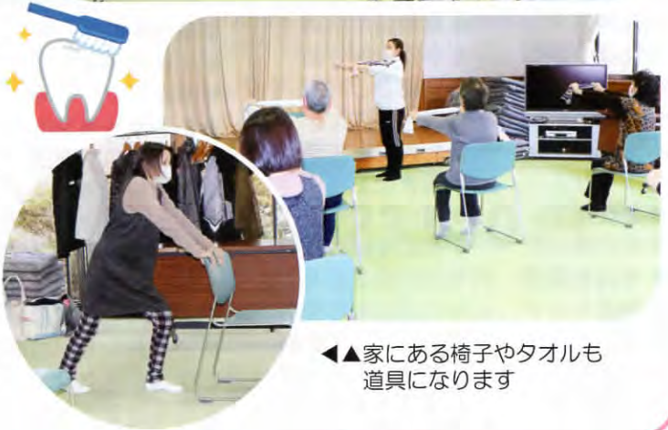
◀◀家にある椅子やタオルも道具になります