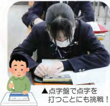
▲点字盤で点字を 打つことにも挑戦!