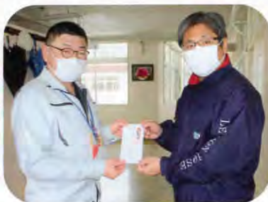
▲鳥海フォスさんへ