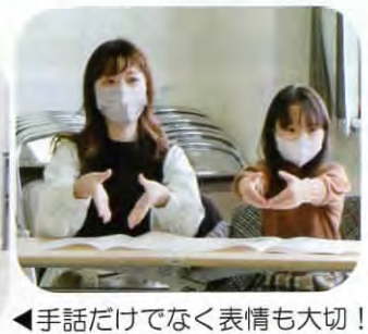
◀手話だけでなく表情も大切!