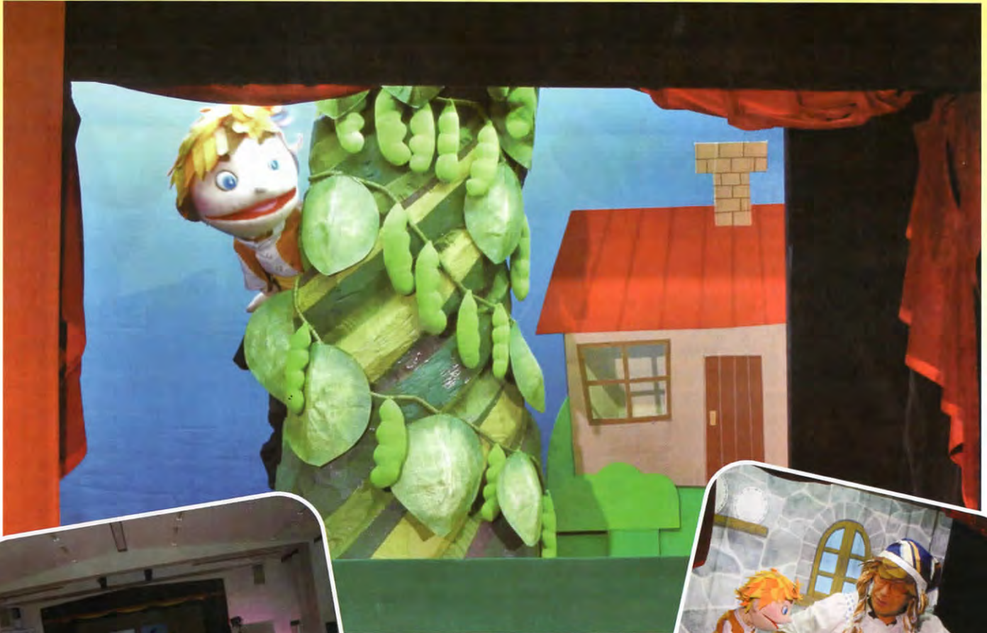
▲迫力満点のセットは手作り！