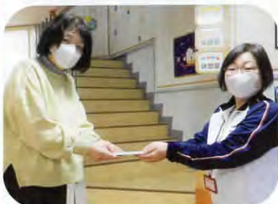
▲勢至保育園さんへ