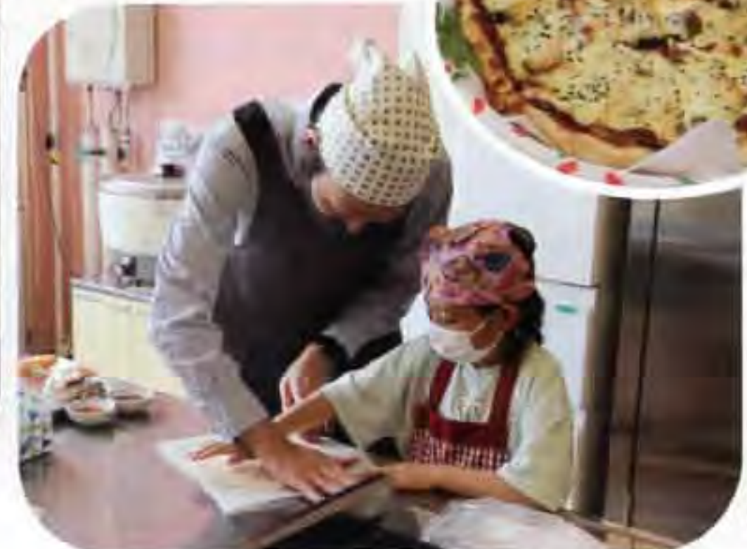
▲ピザを生地から作るのは初めて!