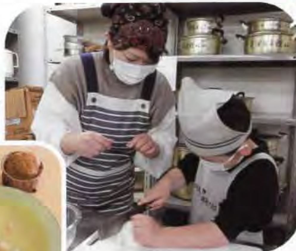
▲玉ねぎを切る時は猫の手で…