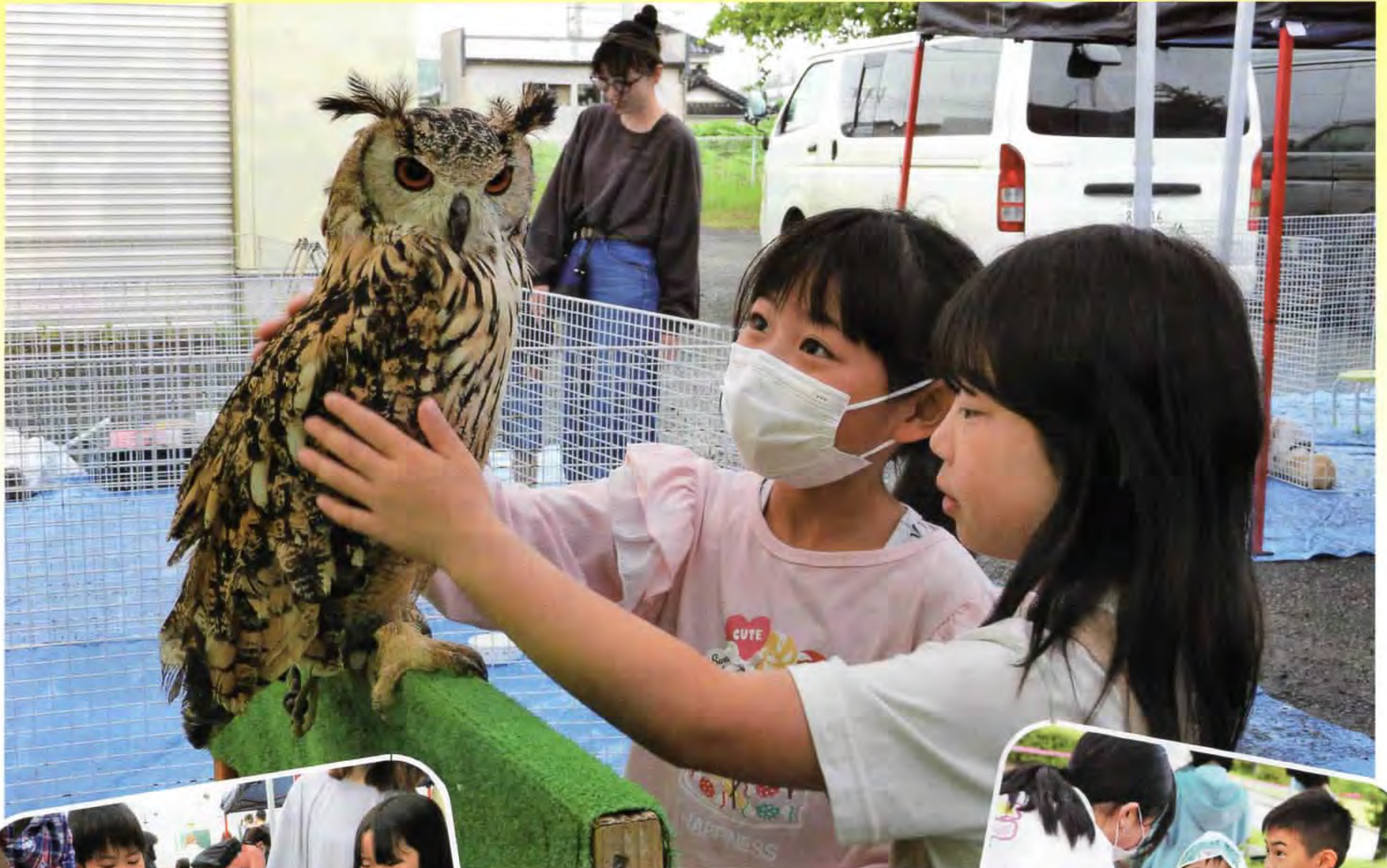
▲ふわふわの羽が気持ち良いね♪