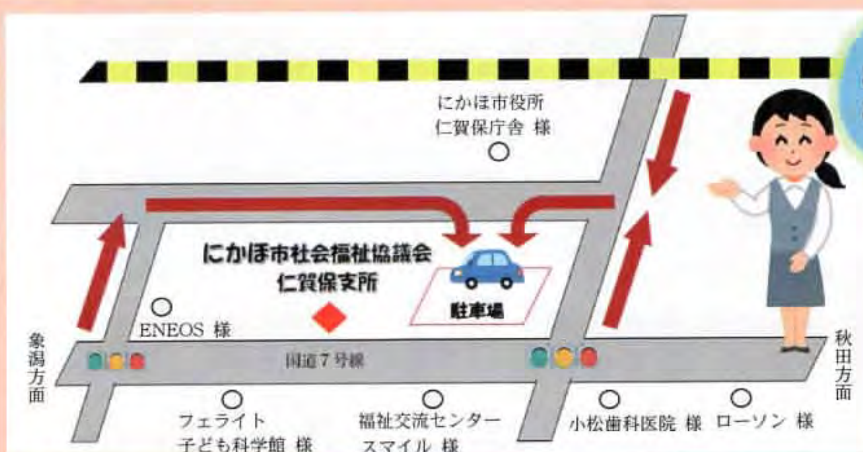
▲スマイルとお間違えのないように…

にかほ市総合福祉センタースマイルから現在の事務所へと移転し、1年が経ちました。皆様にはご不便をお掛けいたしました。改めて案内図を掲載させていただきます。