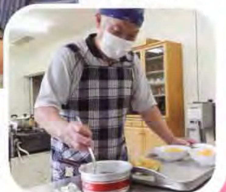
男性も活躍しました! ▶