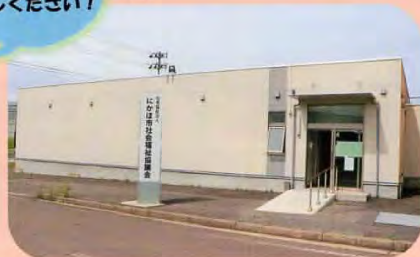
◀「にかほ市社会福祉協議会」の看板が目印です

にかほ市総合福祉センタースマイルから現在の事務所へと移転し、1年が経ちました。皆様にはご不便をお掛けいたしました。改めて案内図を掲載させていただきます。