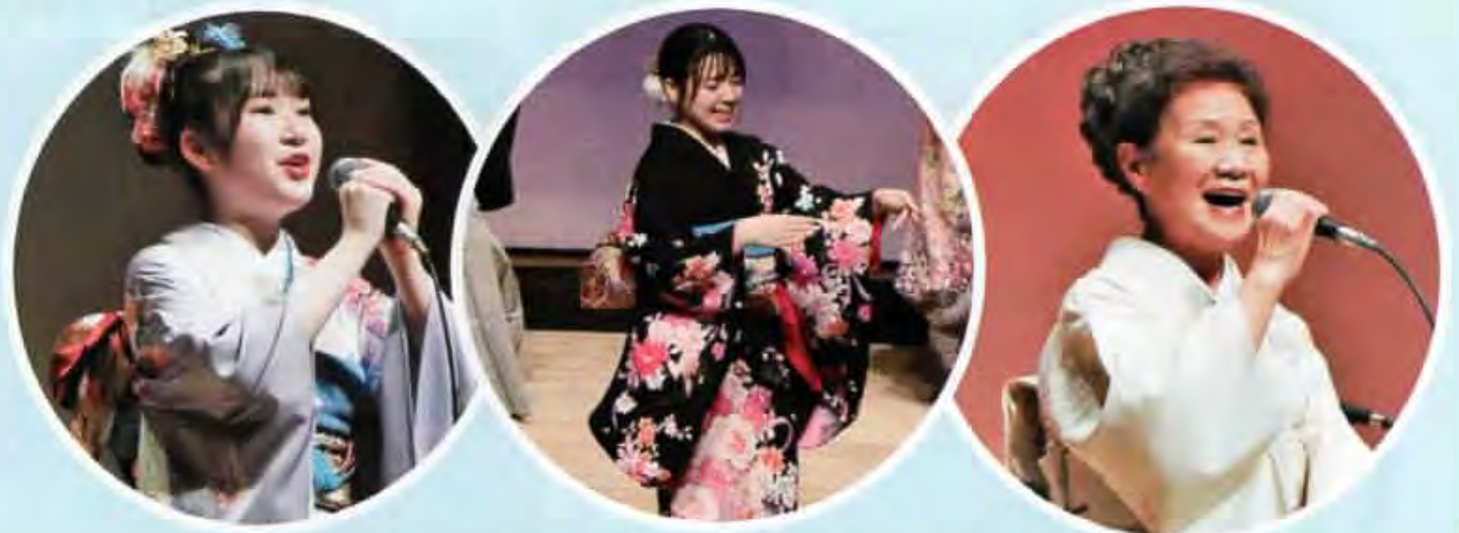
▲素晴らしい歌声が会場に響き渡りました

6月18日(日)仁賀保勤労青少年ホームにて「梅若流梅若会 公演会」を開催しました。昨年に引き続き「日本民謡梅若流梅若会」の方々をお招きし、素晴らしい楽器の演奏に合わせた歌や踊りを披露していただきました。