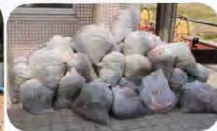
▲こんなにたくさんの草が集まりました!