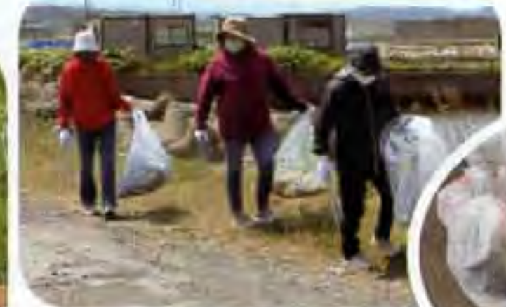
参加して下さった皆さんと! ▼