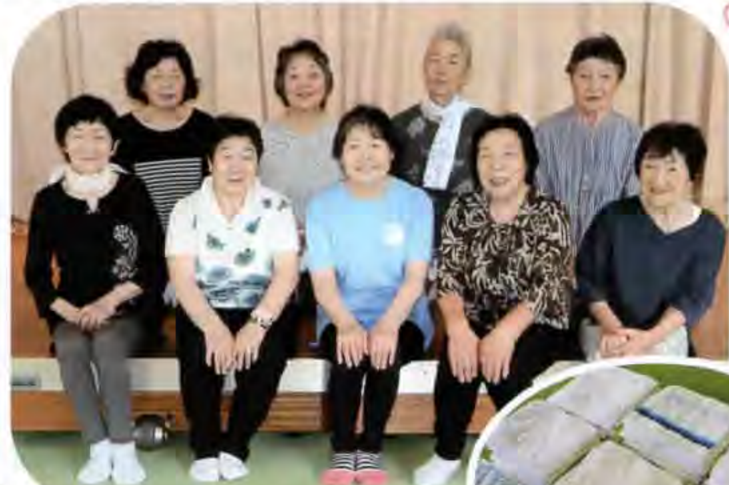
▲女性部役員の皆さん(上)と手縫いタオル(右)

にかほ市老人クラブ連合会仁賀保支部女性部より、手縫いタオル等をご寄付いただきました。これは、女性部の奉仕活動として、長年取り組んでいるものです。ご寄付いただいた手縫いタオルは、仁賀保地域の福祉施設や小中学校、保育施設、公共施設へお届けしております。会員の皆様のあたたかいご厚意にお礼申し上げます。どうもありがとうございました！