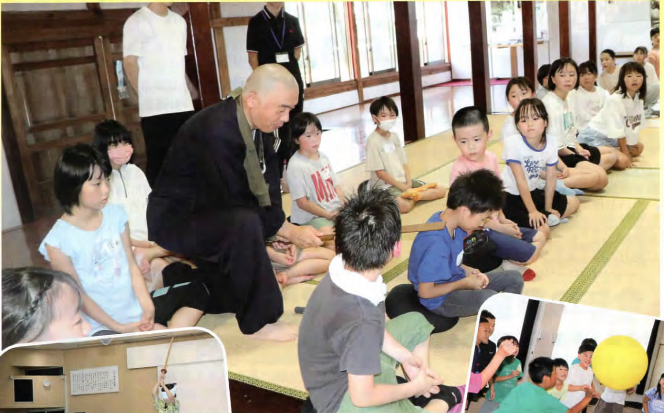
▲座禅体験もしました！（象潟）