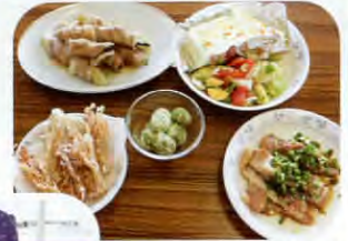
▲「塩鶏」「サラダ寒天」など、栄養バランスもバッチリ！