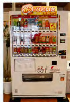
▲福祉交流施設たんぼほにも設置しています

赤い羽根自動販売機は、商品購入の際、おつりを気軽に募金できる販売機です。にかほ市内にも4ヶ所に設置されているので探してみてくださいね。見かけた際は、ご協力よろしくお願い致します。