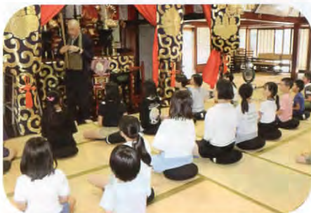
▲なかなかできない座禅体験では、皆さん真剣に話を聞いています