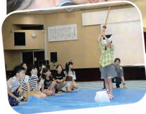
▲ドキドキのスイカ割り！ うまく割れるかな？（金浦）