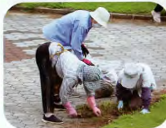
▲潮風公園奉仕活動の様子(にかほ市仁賀保赤十字奉仕団)