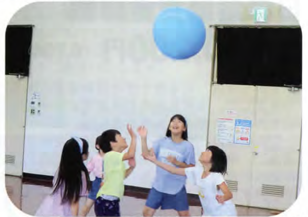
▲暑い日でしたが、たくさん身体を動かしました！