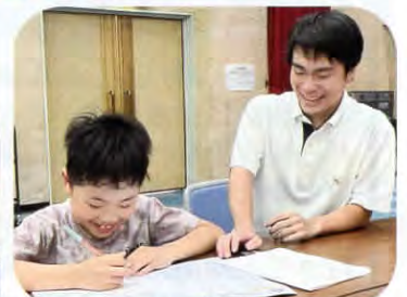
▲仁賀保高校B&V同好会の皆さんが、勉強も教えてくれました