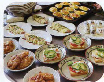
◀盛り付けまで丁寧に…