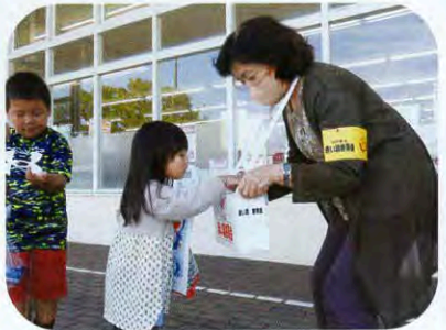
▲マックスバリュ金浦店にて(金浦)