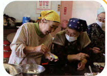
▲熱心に教わっています

皆さん手際よく調理を進め、ズラリと料理が並んだ調理室には、秋の香りが漂いました。