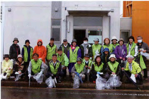
▲民生委員を中心に24名の方がご協力してくださいました