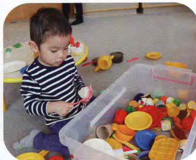
▲おままごとに夢中！