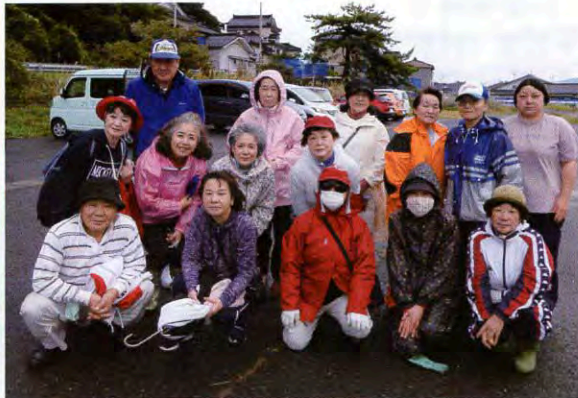
▲雨が降る中、14名の方が参加してくださいました