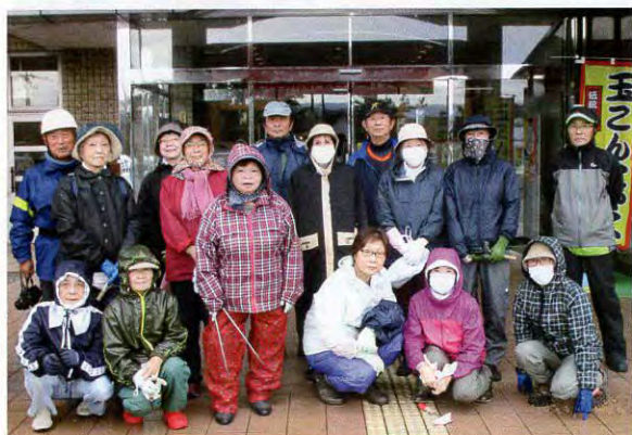
▲16名の方が手際よく作業してくださいました