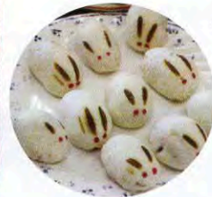
◀熱した棒を生地当てると、かわいらしいうさぎが完成しました！