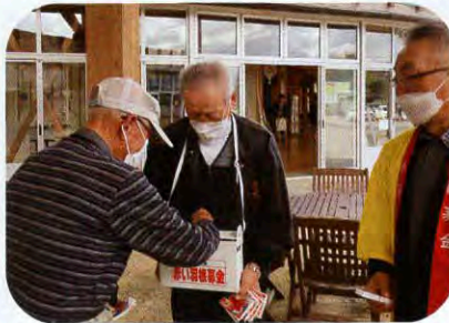
▲にかほつとにて(象潟)

10月1日(日)・2日(月)の2日間、市内6ヶ所で街頭募金を実施しました。赤い羽根共同募金配分金をいただいている団体様をはじめとした沢山の方々よりご協力をいただきました。社協役職員と一緒に募金を呼びかけ、49,353円の募金が集まりました。買い物に訪れたお客さんが足を止め、快く募金にご協力いただきました。どうもありがとうございました。また、募金活動場所を提供してくださった店舗にも心より感謝申し上げます。